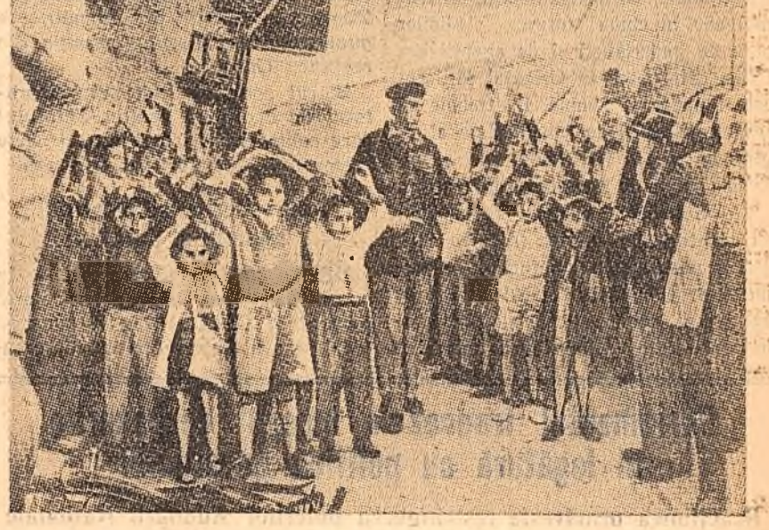
„Cișcul de mai sus, reprodus din revista „Time” (11.III.1957), redă un aspect al represiunii trupelor engleze împotriva populației cipriote. După cum se vede, nici copiii nu sînt cruțați de teroarea colonialistă.”

„La Sibiu, publicistul vest-german a vizitat policlinica orașenescă. „Vizita a produs asupra mea o impresie puternică și l-am putut convinge numai cu greu pe profesor — medicul șef — că complimentele mele n-au nicidecum caracterul unui curtoazios exagerate”.