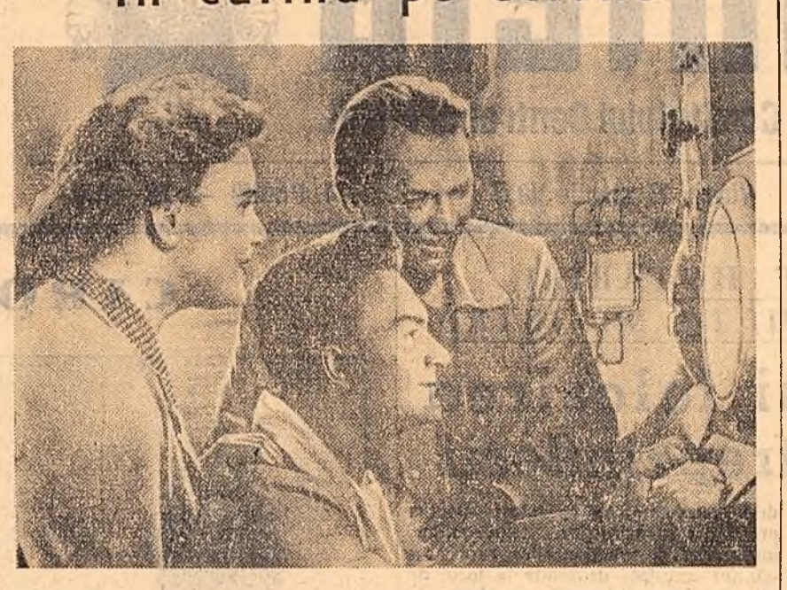
Scenă din filmul sovietic de aventuri științifico-fantastice „Taina nopții eterne”, creat în studiourile „Mosfilm” de regiurul D. Vasiliev (scenariul I. Lukovski). Filmul acesta, a cărui acțiune se petrece în mare parte în fundul oceanului, va fi prezentat în curînd pe ecranele cinematografele noastre.