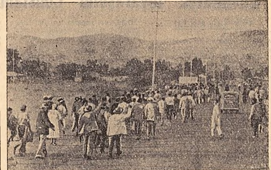
„Azikwehlah” — „Nu vom merge cu autobuzul” este lozincă celor ce-si afirmă prin boicot drepturile elementare răpite de rasiștii sud-africani.

În Uniunea Sud-Africană sînt aproximativ 9,5 milioane de negri, 1,2 milioane de locuitori cu sînge amestecat, 400.000 de asiatici (majoritatea indieni) și numai 2,8 milioane de albi.