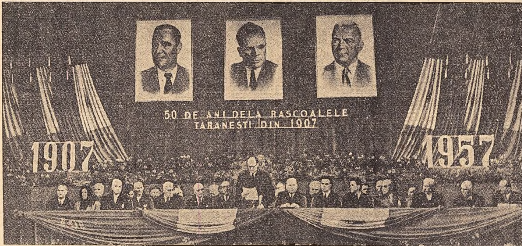
50 DE ANI DE LA RĂSCOALELE ȚĂRĂNEȘTI DIN 1907