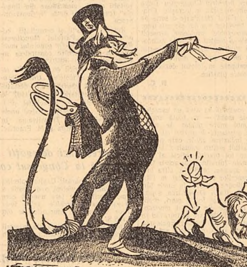
DIPLOMATUL AMERICAN: — Acum cu eforturi unite să pornim la treabă. Desen de EUG. TARU

Gumhurla” subliniază că liderii puterii occidentale își denumesc încercările de a instaura dominația imperialistă în Orientul Mijlociu cînd „împlerea vidului”, cînd „navigația în Orientul Apropiat”. Dar poartele arabe — scrie ziarul — văd primejdia pe care le-o aduce politica occidentală care urmărește să uzurpe drepturile naționale ale arabilor și se unesc pentru a-și apăra interesele naționale. În celelalte sectoare menționate în comunicatul din Bermude, colaborarea anglo-americană se desfășoară după același tipic: acord asupra poliției „de pe poziții de forță”, cu ocrotirea unor chestiuni care nu au fost rezolvate și care ar fi fost în interesul Angliei să fie rezolvate. În Europa, de exemplu, cele două puteri au inclus în comunicatul lor noi calomnii cu privire la relațiile dintre țările socialiste și au ridicat noi ofense faimoselor proiecte ale „unificării” vest-europene. Este semnificativă condiția pe care o pune comunicatul acestei „unificări” — aceea de a nu atrage taxe vamale ridicate. Aceasta este o expresie a grijii pe care o poartă S.U.A. nu desigururi generale a comerțului internațional (în ceea ce privește S.U.A. menționat tot felul de restricții și discriminări) ci posibilității de pătrundere a mărfurilor americane în Europa occidentală. Comunicatul nu