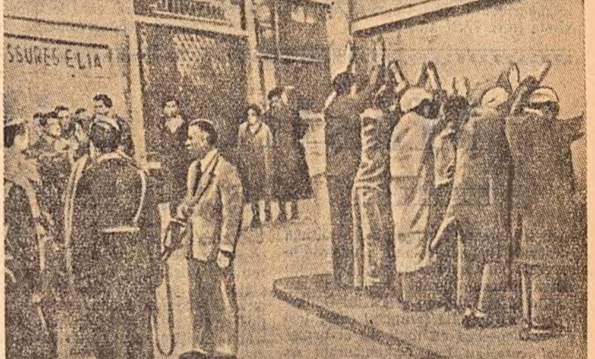
Aproape zilnic în Capitală, autoritățile colonialiste recurg la cele mai bestiale mijloace de reprimare și de batjocorie pentru a învinge dorința de libertate a poporului algerian. Cîștig de mai sus înfășurează un aspect al acestor practici colonialiste. Populația băștinată într-un oraș algerian este silită să stea cu fața la zid și cu minile ridicate sub amenințarea poliștilor pentru percheziții. Mulți algerieni își pierd libertatea și adeseori chiar viața după aceste percheziții de intimidare.