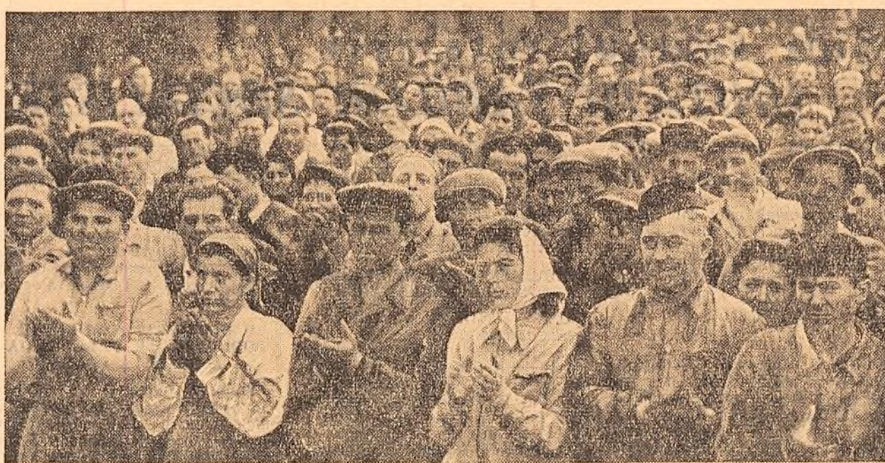
Mii de oameni ai muncii, participanți la însuflețit miting de la Grivița Rosie și-au exprimat solidaritatea lor cu lupta bravului popor algerian împotriva terorii colonialiștilor, pentru libertate și independență națională.

Adunări ale oamenilor muncii din Capitală și din țară