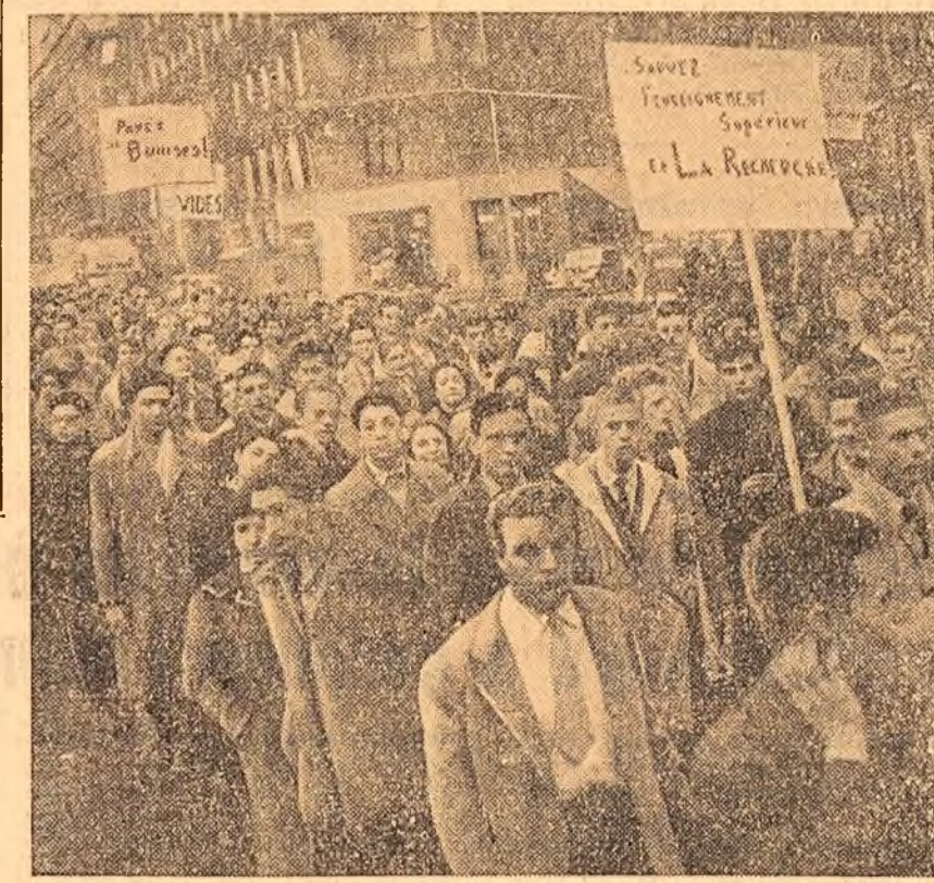
Studentii francezi manifestează pe străzile Parisului pentru îmbunătățirea condițiilor de învățămînt și de cercetare științifică.

Intre lînerii compozitorilor romîni cum nose bine pe Anatol Vieru. Aș putea spune că cunosce foarte puțin din compozițiile sale. Este aspirant în clasa pe care o conduce la Conservatorul din Moscova și apreciez mult talentul lui original. Admir în muzica romîneasă suflul ei puternic național, intonația cîntecelor populare care trec ca un fir conducător în creația compozitorilor romîni. Măiestria compozitorilor romîni este de asemenea de admirat. Aș vrea să folosesc prilejul — a încheiat Hacıaturian — pentru a transmite colegilor mei romîni și turtor iubitorilor de muzică din R.P. Romîna saluții sincere pornite din adîncul inimii. Compozitorii romîni pentru care am o dragoste și simț deosebit le doresc să compună cît mai mult și mai bine, să crească în operele lor mase cît mai largi.