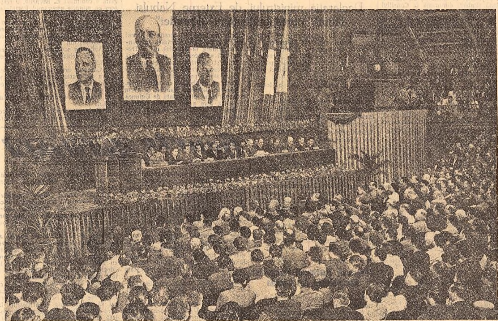
Un aspect din sala „Floresca” în timpul marelui miting al oamenilor muncii din Capitală.