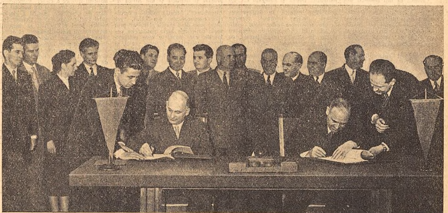
Tovarășii Gheorghe Gheorghiu-Dej și Waldeck Rochet semnează Declarația cu privire la convorbirile dintre delegațiile Comitetului Central al Partidului Muncitoresc Român și Comitetului Central al Partidului Comunist Francez.