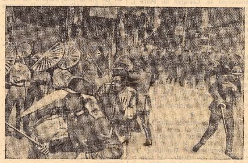
Ciociul între populație și poliție la Amman

• Deputata laburistă BARBARA CASTLE (Anglia): „Dacă poporul din Iordania nu dorește doctrina Eisenhower, S.U.A. nu au dreptul să-și impună cu forța. Trebuie cerut Consiliului de Securitate să discute această problemă, care constituie un pericol pentru pace, așa cum prevede Carta.”