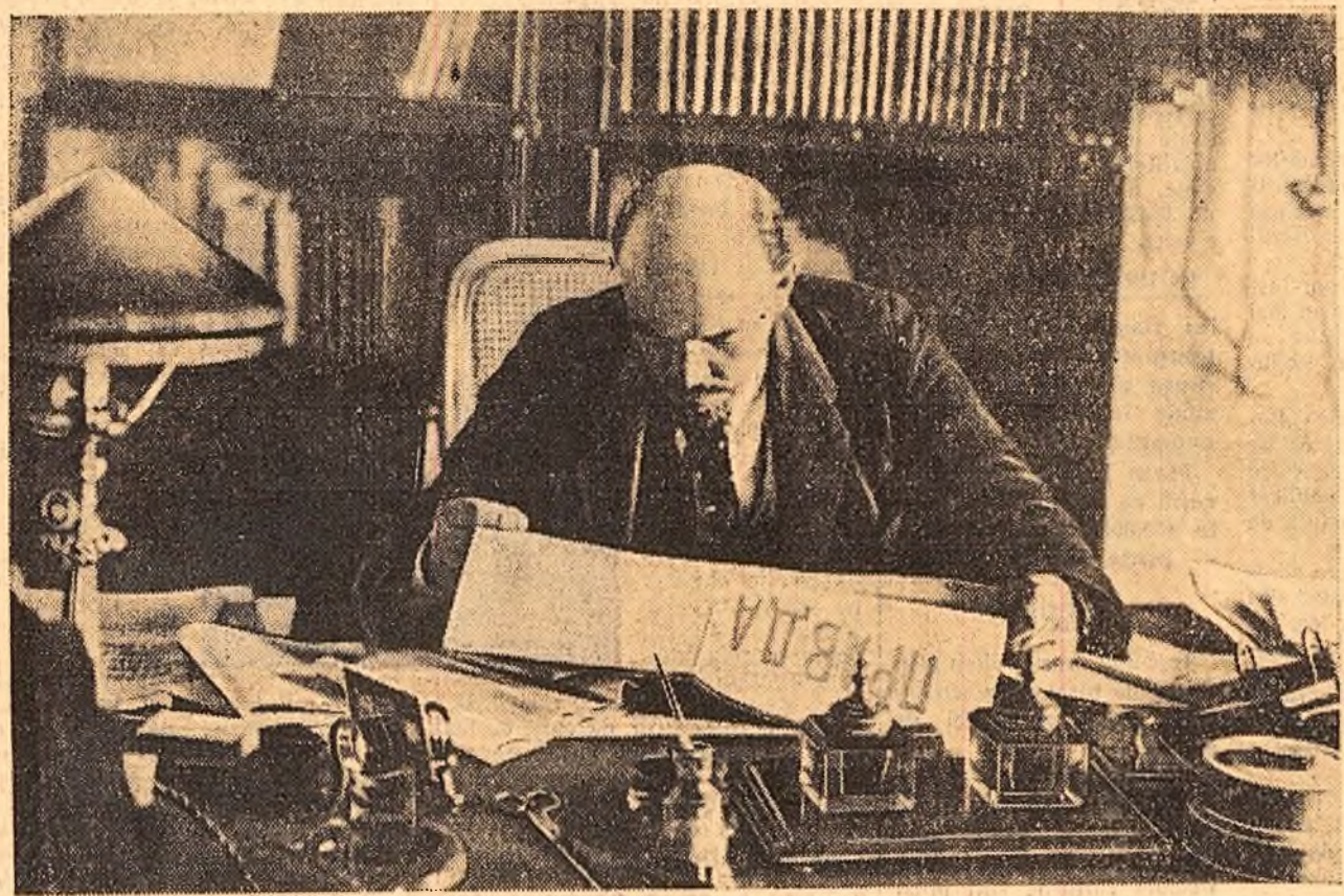
V. I. Lenin în cabinetul său de lucru de la Kremlin. Octombrie, 1918.