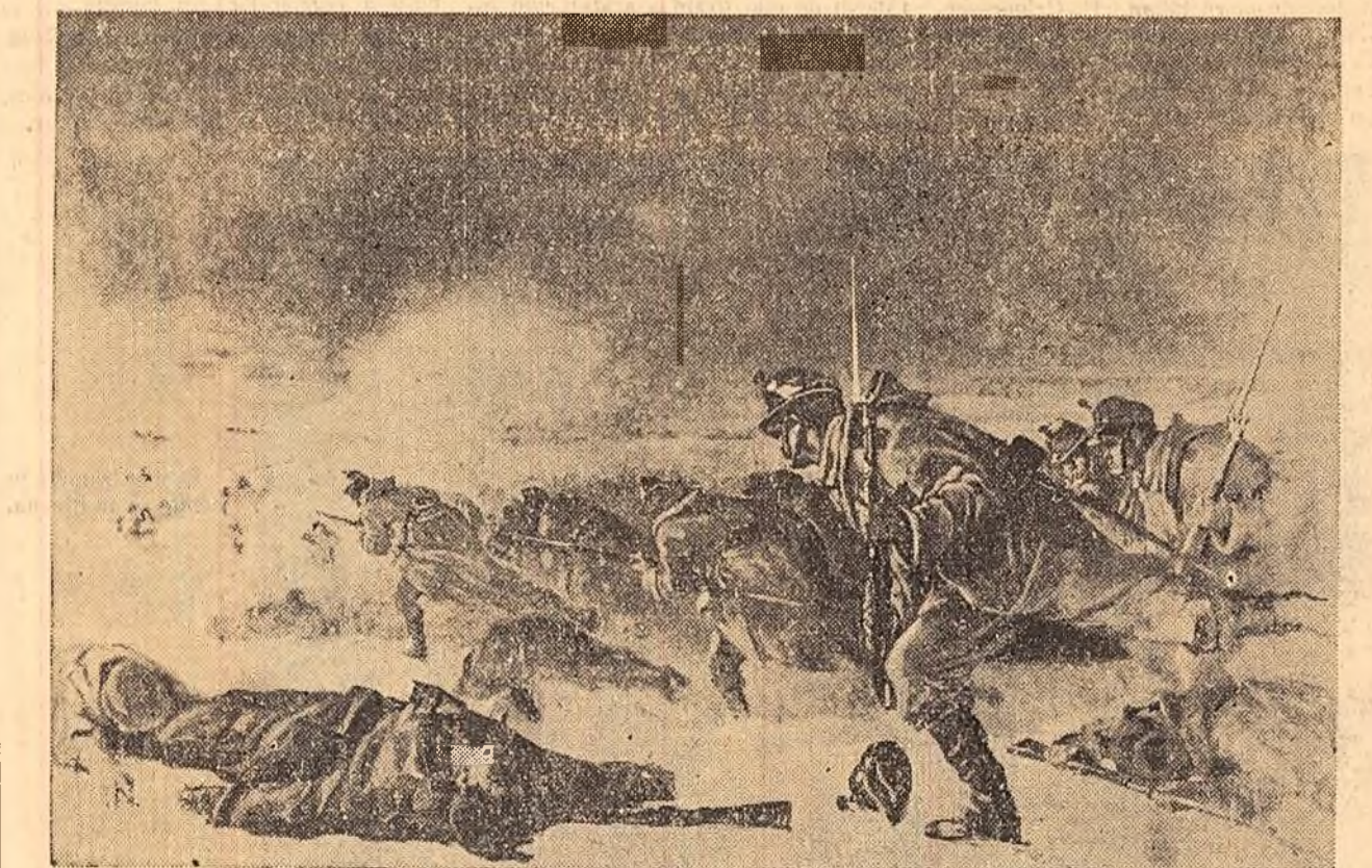
NICOLAE GRIGORESCU: Atacul de la Smirna

Turneul artiștilor sovietici în România va dura aproximativ două săptămîni.