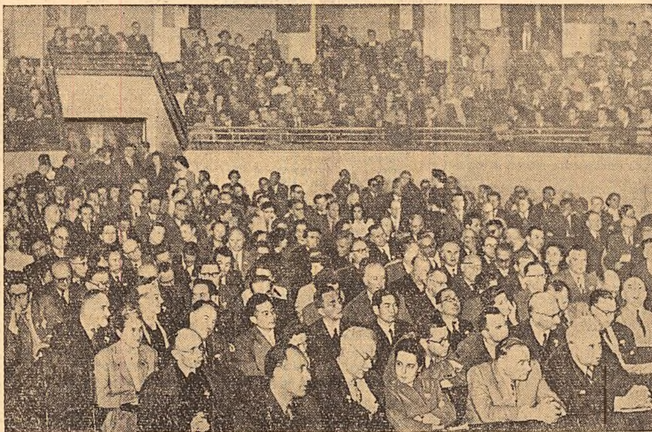
Un aspect din timpul lucrărilor ultimei zile a Congresului