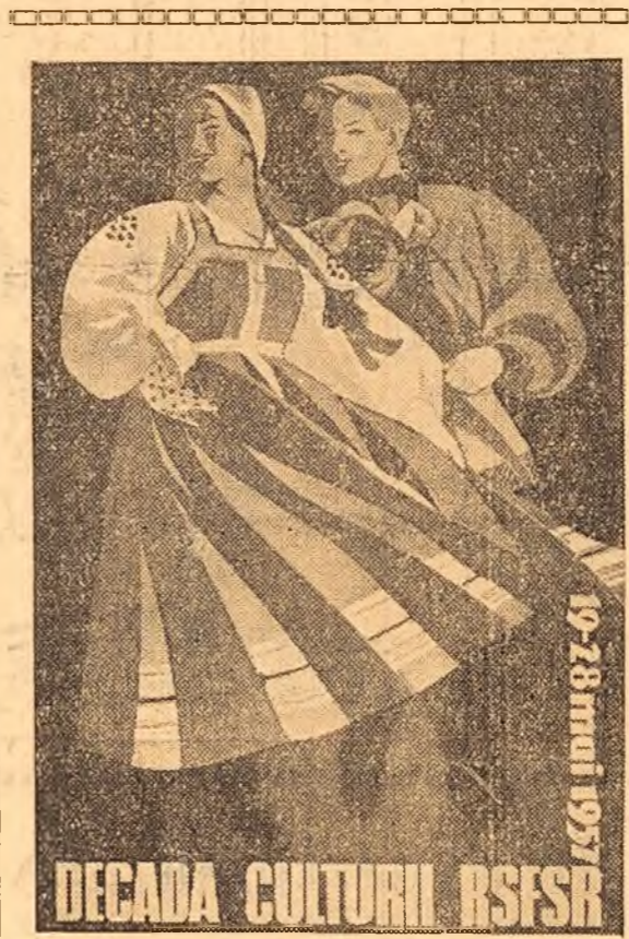
DECADA CULTURII R.S.F.S.R.

BACAU (coresp. „Științei”). — La căminele culturale din satele regiunii Bacău, la cluburile și colturile roșii din gospodăriile colective au avut loc în ultimele zile adunări ale țăranilor muncitori în cadrul cărora membrii comitetelor executive ale sfaturilor populare, activiștii ai cooperărilor și ai întreprinderilor comerciale de stat „Recolta” au vorbit pe larg despre avantajele ce le aduce hotărîrea Consiliului de Miniștri privitoare la contractările de cereale.