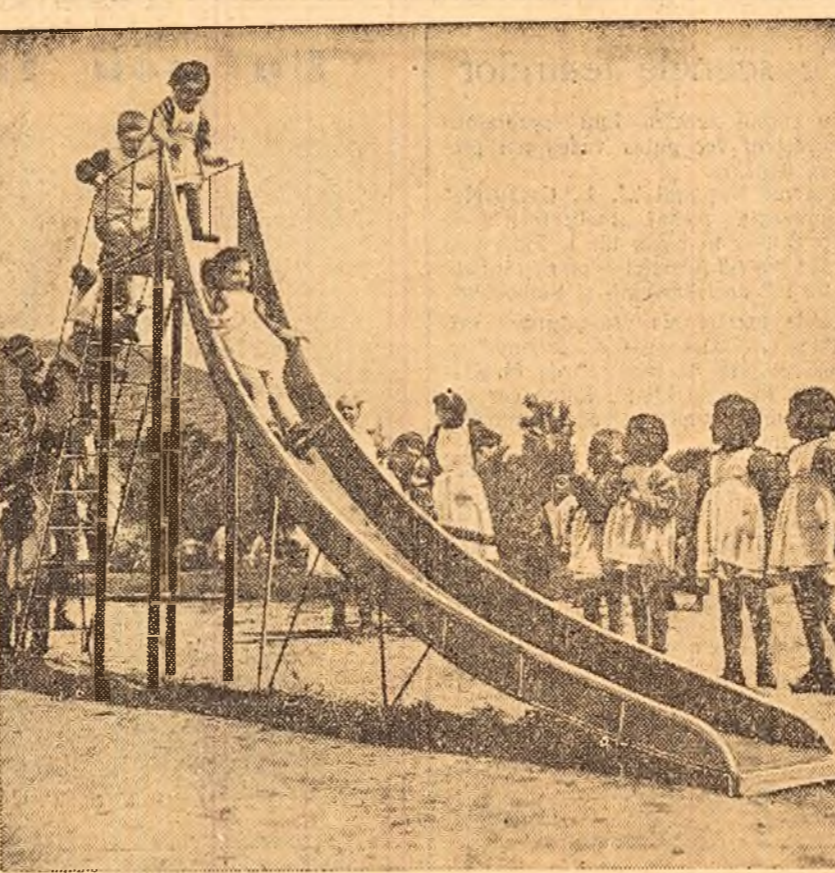
Peste 200 de copii ai muncitorilor fabricii de confecții „Gh. Gheorghiu-Dej” din Capitală își petrec timpul în cîmpul de zi. Ei au la dispoziție săli de clasă, dormitoare, un parc pentru distracții în aer liber. În clișeu: Una din bucuriile copiilor: toboganul.