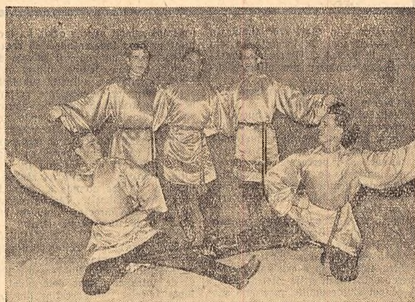
Un aspect de la spectacolul de cintece și dansuri dat de corul popular rus din Omsk.