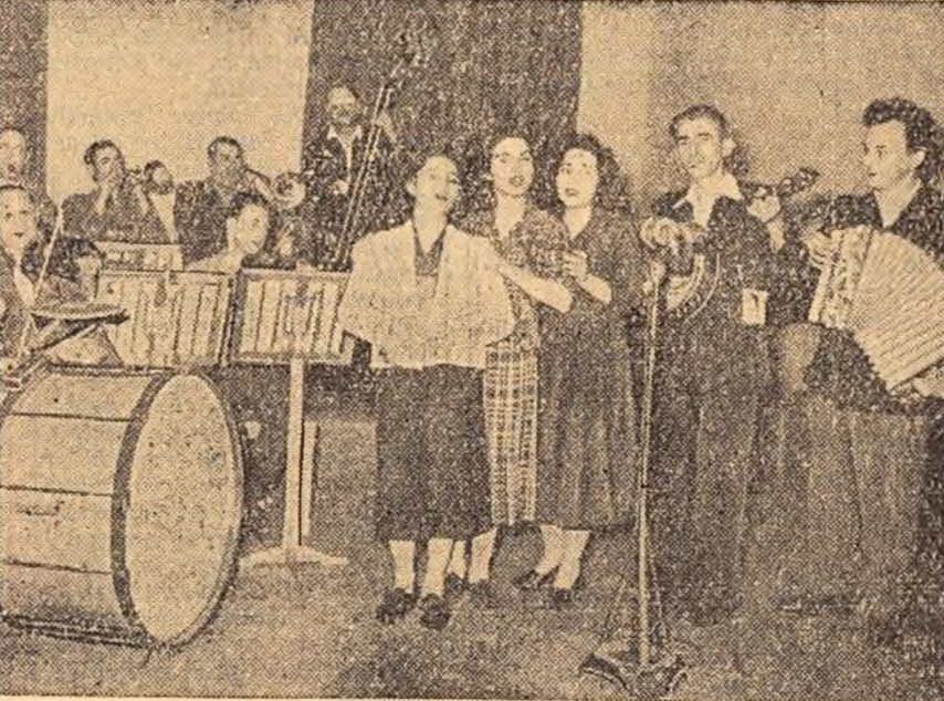
În rafturile bibliotecii Casel de cultură din Reșița cititorii găsesc circa 100.000 de volume; în cîteva cercuri artistice s-au dezvoltat talentele... În clișeu: Ansamblul de estradă al combinatului siderurgic prezentînd un program artistic.

Tărani muncitori care au participat la consfățuirile și-au exprimat hotărîrea ca în acest an să muncască mai bine pentru a obține recolte sporite.