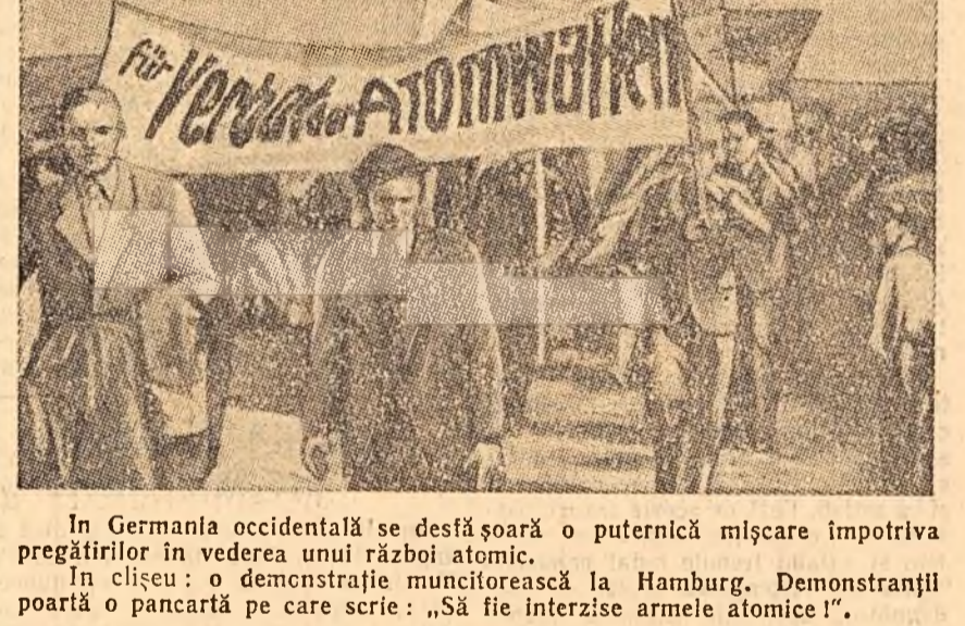
În Germania occidentală se desfășoară o puternică mișcare împotriva pregătirilor în vederea unui război atomic. În clișeu: o demonstrație muncitorească la Hamburg. Demonstrații poartă o pancartă pe care scrie: „Să fie interzise armele atomice!”

Berlinul trebuie să fie un exemplu de acțiuni comune ale clasei muncitoare împotriva militarismului, un exemplu de luptă comună a tuturor forțelor democratice în cadrul Frontului Național, a spus W. Ubricht. Dacă și în Berlinul occidental forțele democratice și iubitoare de pace vor ocupa o situație dominantă, marelle Berlin va avea perspectiva de a deveni un oraș al păcii, capitala unui stat german unit, înaintat din punct de vedere economic și politic.