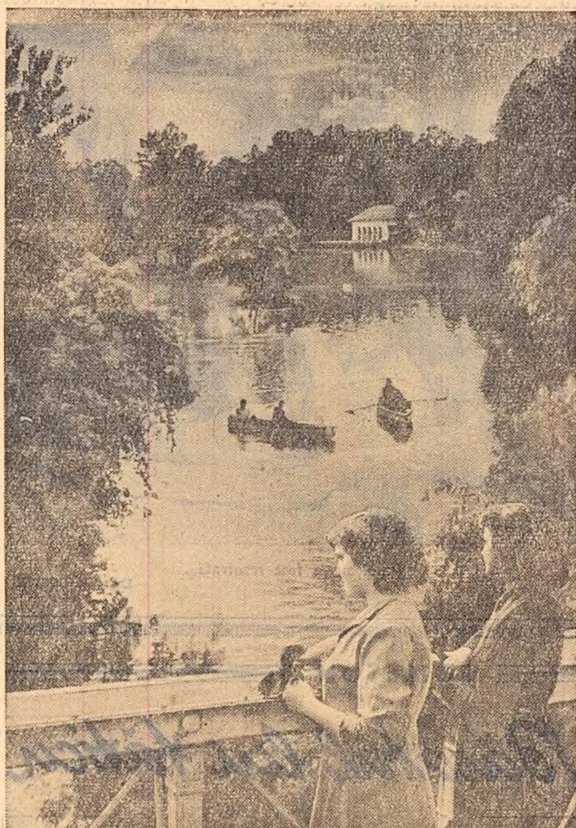
Minunat de frumos este parcul din Craiova! Mai ales primăvara. Nu te mai satură admirându-l. Și într-o zi caldă și însorită, cum se arată a fi în fotografia noastră, o plimbare cu barca pe lac e o adevărată bucurie.