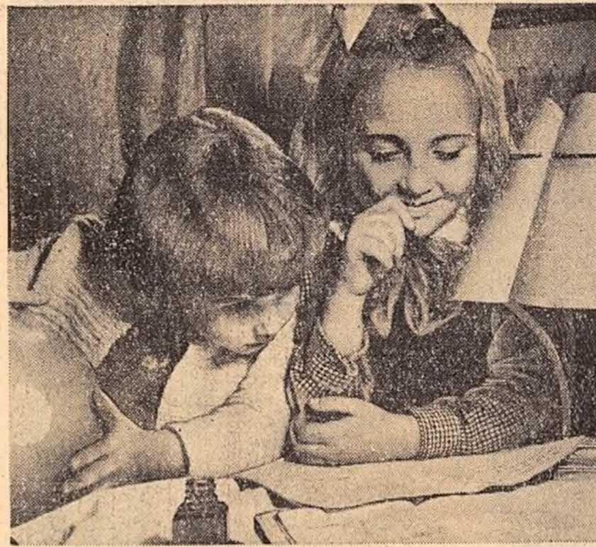
Problema a fost rezolvată...