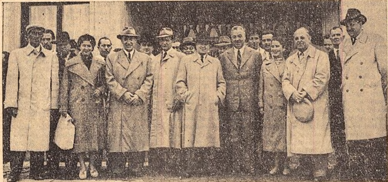
La plecare, pe aeroportul Băneasa. (Darea de seamă în pag. V-a)