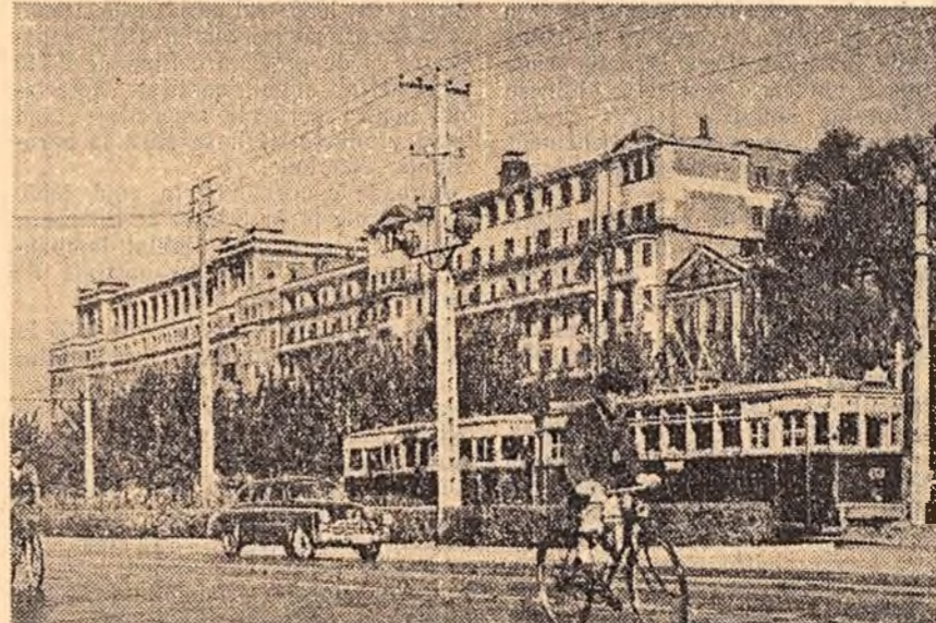
Pekinul de azi

Pekinul, centrul unei strălucite și străvechi culturi, este astăzi capitala unei mari puteri socialiste. El se transformă o reperiție într-unul din cele mai moderne orașe ale lumii.