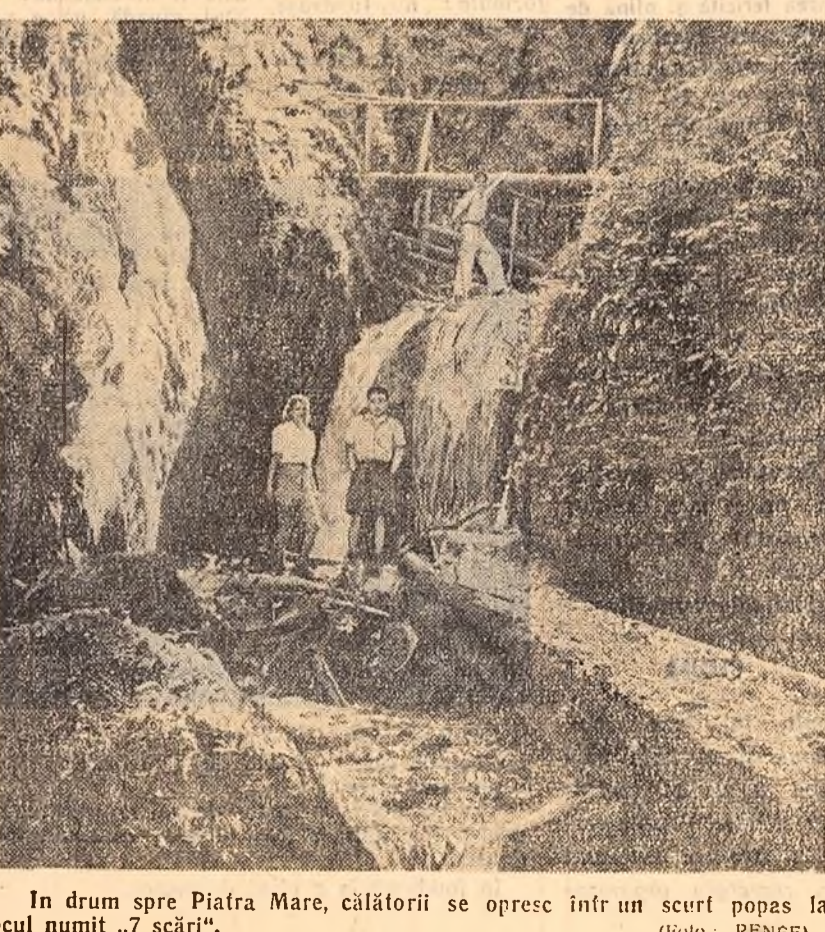
În drum spre Piatra Mare, căldorii se opresc într-un scurf popas la locul numit „7 scări”

Vrem să încheiem reportajul nostru cu un fapt istoric. În arhivele uzinei se păstrează și azi un document. O sarcină importantă a cercurilor A.S.I.T. este aceea de a desfășura o acțiune sistematică pentru combaterea elementelor de rutină și de stagnare în tehnică și de a contribui la crearea unei opinii obștești de interes și preocupare pentru însușirea a tot ce este nou și înaintat în tehnică și în organizarea producției. Pentru mobilizarea largă a inginerilor și tehnicienilor în activitatea cercurilor A.S.I.T., pentru legarea mai strînsă a acestor cercuri de marea masă a muncitorilor, apare necesară aplicarea consecventă a stimulentei morale și materiale. Considerăm că ar fi folositoare introducerea unor insigne și diplome pentru evidențierea meritelor inginerilor și tehnicienilor care se disting în lupta pentru progresul tehnic și pentru perfecționarea organizării muncii și a producției. Cadrele noastre de ingineri și tehnicieni o bună pregătire tehnică și o bogată experiență organizatorică reprezintă o forță uriașă. Ne exprimăm convingerea că cel de-al II-lea Congres al Asociației Științifice a Inginerilor și Tehnicienilor va găsi cele mai potrivite mijloace pentru a ridica nivelul activității acestor cadre în rîndurile asociației, va perfecționa metodele de muncă ale asociației, în interesul înfloririi mai departe a economiei noastre naționale, al construirii bazei economice a socialismului în patria noastră și al ridicării nivelului de trai al poporului.