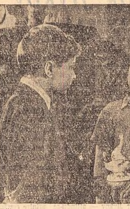
Bătăutul din stînga este Alioşa, iar cel din dreapta — Boris, eroii principali ai filmului „VOCATIE”, realizat în studiourile „Maxim Gorki” din Moscova de regiunea Maria Feodorova (scenariu: V. Spirin). Întîlnirînd formula „copilului minune”, autorii filmului „Vocatie” descriu ascensiunea unui tânăr talent muzical, ale cărui posibilităţi dau roade datorită dragostei şi grijii celor din jur.

La cererea unor propagandişti lectorii au clarificat problemele legate de caracterul imperialist al primului război mondial şi rolul României în acest război, caracterul mişcării muncitoreşti pînă la crearea partidului şi multe altele probleme.