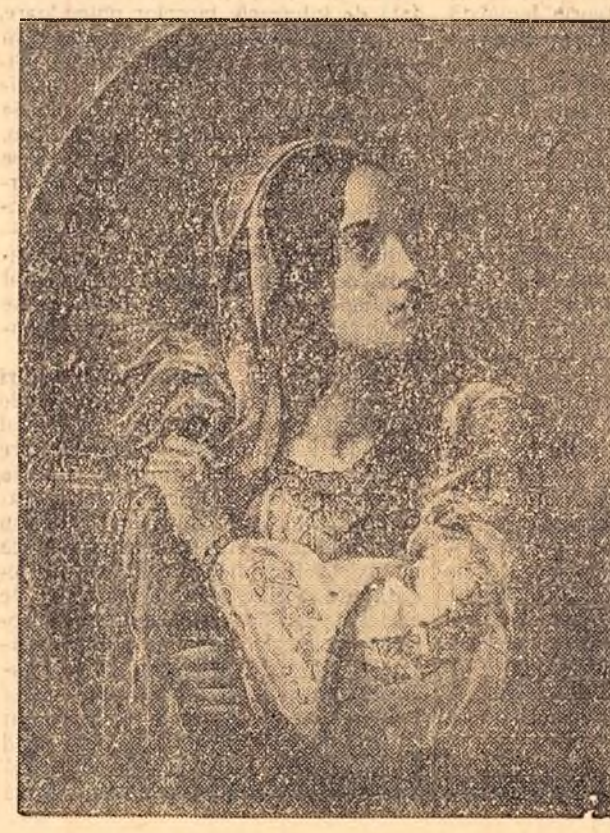
Reproducere după tabloul alegoric „România revoluționară” al pictorului Constantin Daniel Rosenthal, contemporan al revoluției de la 1848.

Capacitatea stațiunii a crescut de la 200 locuri la 300 iarna și 500 vara. În stațiune se tratează bolnavi de stomac, de ficat, diabet, colită etc. Pentru îngrijirea acestora în stațiune lucrează 11 medici specialişti. De asemenea stațiunea dispune de cabinete de radiologie, fizioterapie, stomatologie. Se fac tratamente cu raze ultrasonice și ultraviolete. În cele 10 pavilioane a fost adus mobilier nou. Bucătăria prepară 7 regiuniri dietetice, după prescripția medicală.