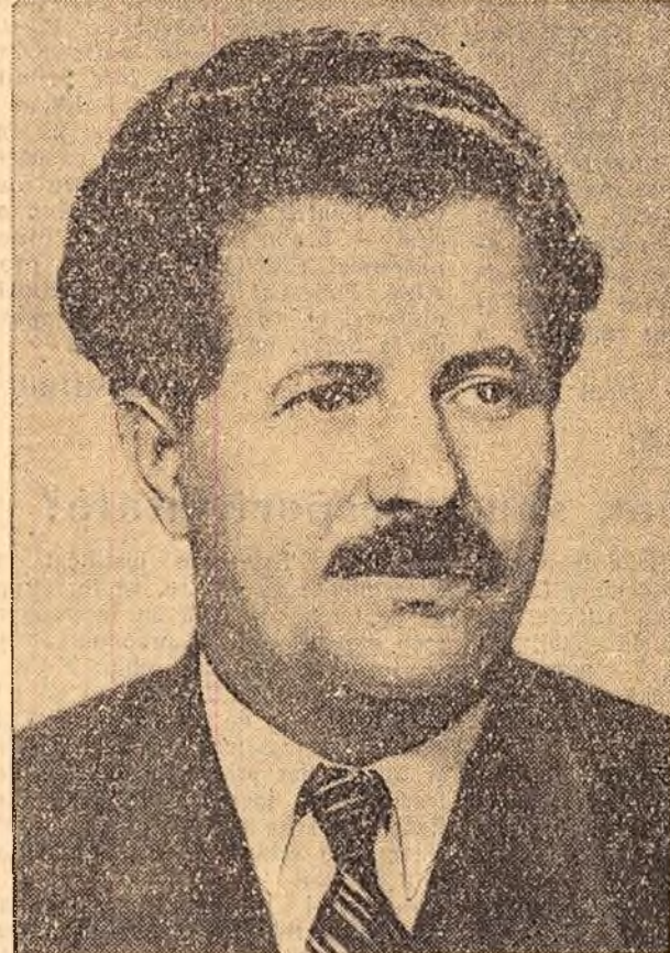
Tovarășul ANTON IUGOV

• Vizita în România a delegației guvernamentale și de partid bulgare va aduce o contribuție prețioasă la dezvoltarea continuă a prieteniei și colaborării multilaterale romino-bulgare, la cimentarea legăturii frățești dintre partidele marxist-leniniste din cele două țări și totodată un aport la cauza întăririi continue a unității și coeziunii întregului lagăr socialist. • Poporul român salută cu bucurie soseirea în țara noastră a scumpulor săi oaspeți bulgari și le adresează un călduros „Bine-ați venit!”