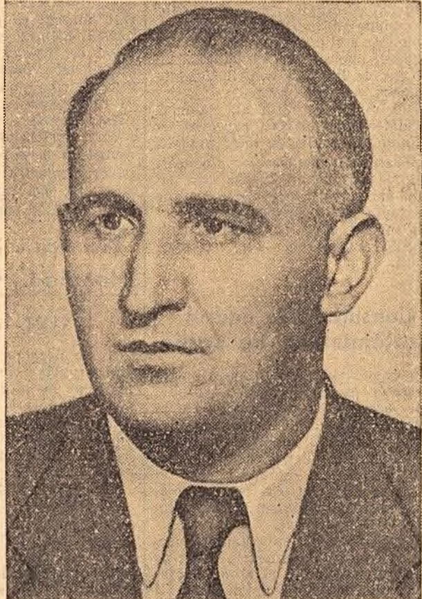
Tovarășul TODOR JIVKOV

Primul secretar al Comitetului Central al Partidului Comunist Bulgar, tovarășul TODOR JIVKOV, este unul dintre cei mai de seamă activiști de partid și de stat din Republica Populară Bulgaria.