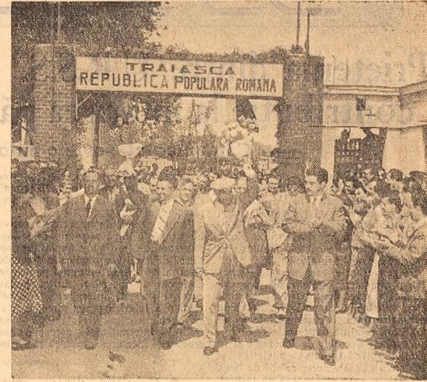
Muncitorii uzinelor „Steagul Roșu” din Orașul Stalin întîmpină pe oaspeții bulgari

ritindu-se nu numai necesarul pieței interne ci și disponibilități pentru export. Paralel cu succesele în producție, muncitorii se mîndresc cu realizările de locuințe muncitorești, cu marile centre școlare profesionale, „Orașul unccilor” și cu alte realizări sociale. Membrii delegației bulgare au vizitat apoi mai multe sectoare ale uzinelor: fabrica de rulmenți, secțiile care cardanice, bloc motor, mașinile-agregate, montaj general. Întîmpinați călduros de muncitorii și tehnicienii, oaspeții au