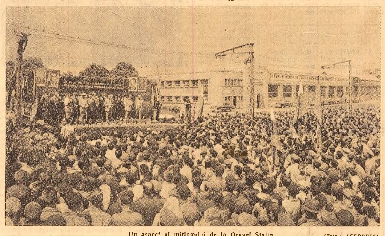
Un aspect al mitingului de la Orașul Stalin.

ORĂȘUL STALIN 13 (de la trimiterea specială „Agerpres”). Joi dimineața, delegația guvernamentală și de partid a R. P. Bulgaria, în frunte cu tovarășii Anton Iugov și Todor Jivkov, și-a continuat vizita în importantul centru economic — Orașul Stalin.