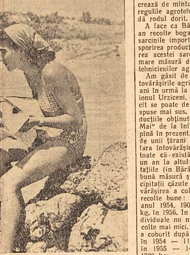
Prima cunoștință cu apa mării nu e lipsită de oarecare emoții. De aceea ajutorul mamei în asemenea situații este binevenit și cel mai tînăr oaspete al litoralului începe să se simtă în largul lui.