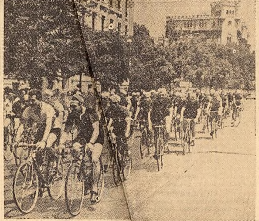
S-a dat startul în Cursa munților