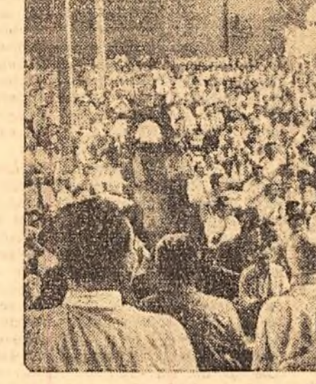
Un aspect al sălii în timpul Congresului

lupta comună a popoarelor pentru dezarmare, pentru interzicerea experiențelor cu arme nucleare și a producției acestor arme poate fi încununată de succes prin întărirea și dezvoltarea unității de acțiune a clasei muncitoare din toate țările și a acțiunii ferme a forțelor mondiale ale păcii. Chemarea la unitate proletară adresată acum peste 100 de ani de Marx și Engels are în zilele noastre o însemnată hotărîtoare nu numai pentru destinele clasei muncitoare ci și pentru destinele întregii omeniri amenințate în însăși ființa ei de efectele distrugătoare ale armelor nucleare; consecvențe principiului coexistenței pașnice între toate statele, indiferent de oriundea lor socială, sindicatele din țara noastră sprijină orice acțiune, orice inițiativă, orice pas, oricît de mic în direcția realizării și întăririi unității naționale și internaționale a celor care muncesc. Noi sprijinim politica externă a guvernului R. P. Romîni îndreptată spre dezvoltarea colaborării cu toate statele. Am salutat cu multă satisfacție recentele înțelegeri economice și culturale între R. P. Romîni și Franța, cu convingerea că ele reprezintă nu numai un pas însemnat în dezvoltarea legăturilor tradiționale dintre popoarele noastre, ci și o contribuție valoroasă la promovarea ideii de colaborare între state.