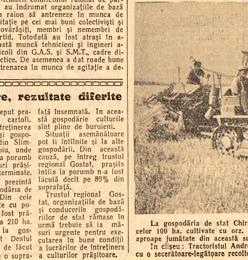
La gospodăria de stat Chirnovi, raionul Oltenița, a început recoltatul celor 100 ha. cultivate cu orz. Pînă acum a fost strînsă recolta de pe aproape jumătate din această suprafață.