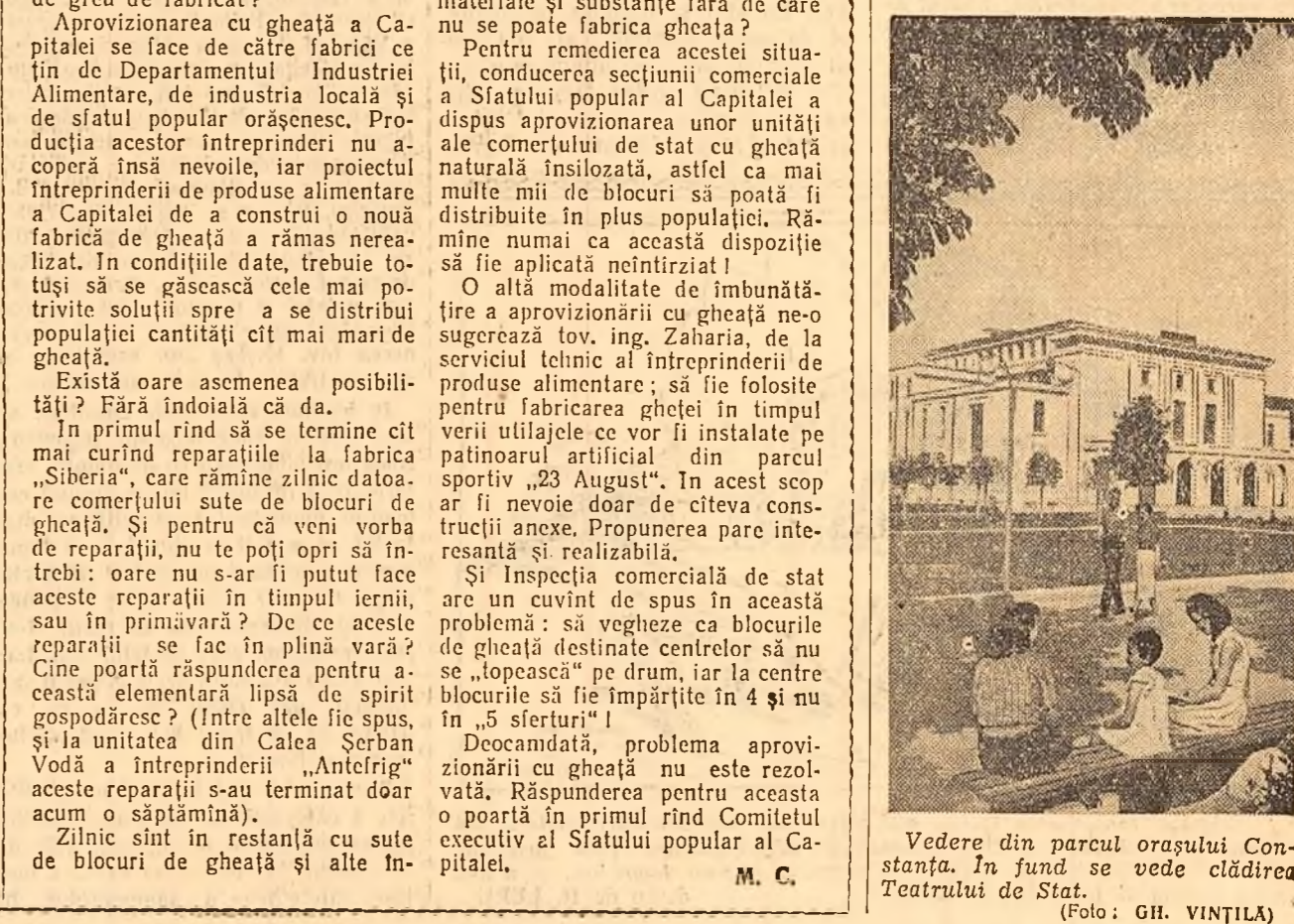
Vedere din parcul orașului Constanța. In fund se vede clădirea Teatrului de Stat.