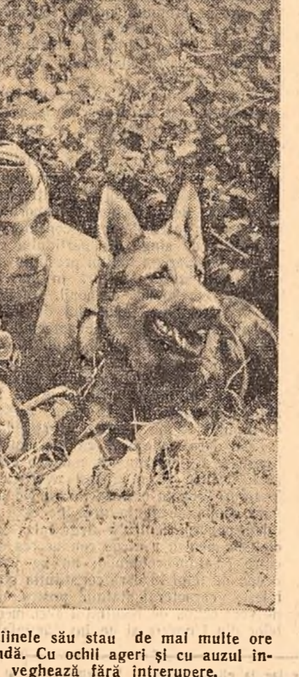
Grănicerul și cîinele său stau de mai mult ore în locul de pînă. Cu ochii așeri și cu auzul acordat ei veghează fără întrerupere.

— Patrulea de cercetare a ajuns la cantonul de cale ferată — conchise caporalul.