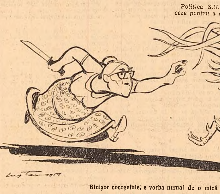
Binșor cocoșelule, e vorba numai de o mică ajustare! Desen de EUG. TARU

Dulles a fost nevoit să recunoască că China populară nu numai că există, dar are un rol tot mai mare în treburile internaționale. El a încercat, totuși, cu încăpăținare să justifice actuala politică a S.U.A.