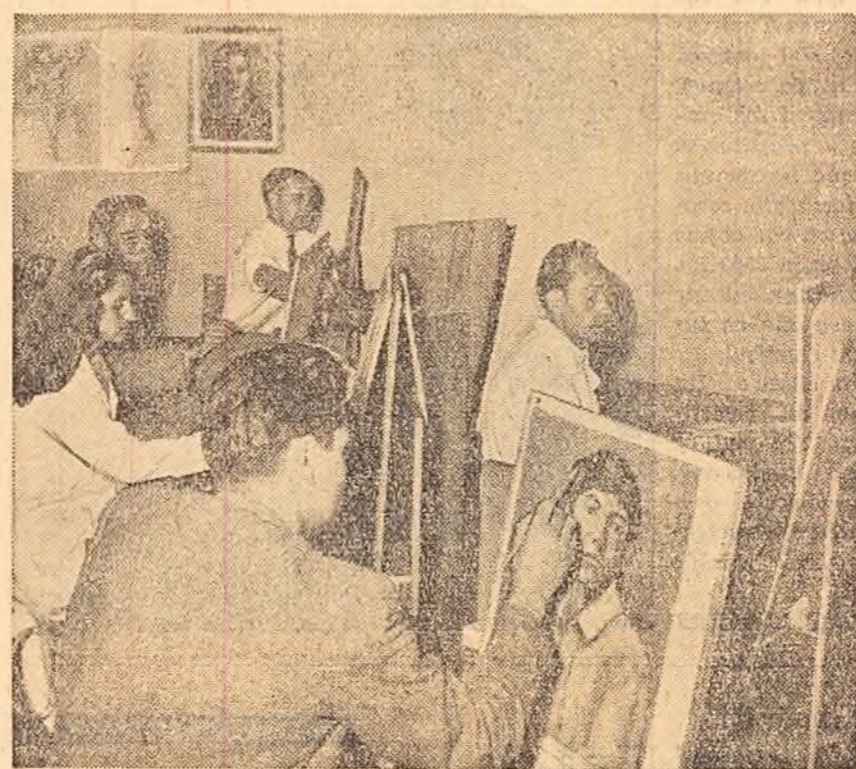
La Palatul Culturii din Cluj funcționează o școală populară de artă de 3 ani. Muncitorii și funcționarii din întreprinderile Clujului care au înclinat spre pictură și spre alte ramuri ale artei plastice, pot să-și valorifice aptitudinile. În fotografie — Un grup de elevi din anul II lucrează la portrete în ulei pentru examenul de sfîrșit de an.