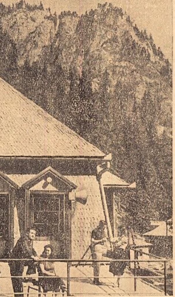
Lacul Roșu — stațiune climaterică, situată în vecinătatea Cheilor Bicazului — oferă oamenilor muncii veniți la odihnă prilej de incalzire, recreație și odihnă binemeritată. Iată-l pe cîțiva dintre vilegiaturii admirind minunatul peisaj alpin...