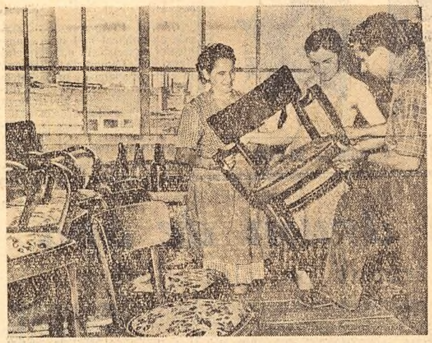
Realizarea unor produse de larg consum nu numai în cantități profunde, ci și de bună calitate, care să corespundă gustului celor care le cumpără...