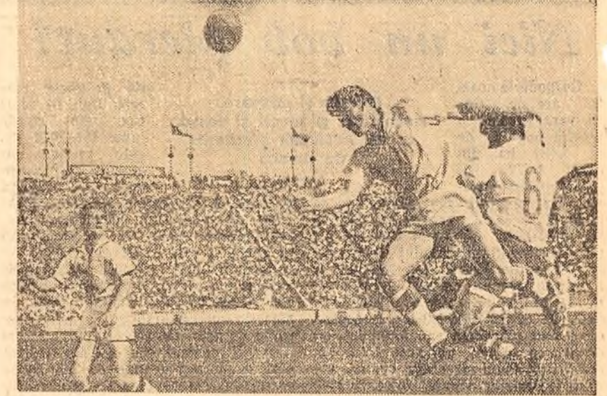
O interesantă fază a meciului Știința-Cluj — Spartak Hradec Kralova

Duminică după-amiază pe stadionul „23 August” a avut loc Festivalul serbărilor de închidere a anului universitar. Zecele de mii de spectatori și sportivi au privit cu admirație defilarea celor 3.200 de studenți, artiștii amatori și sportivi care vor participa în aceste zile la interesante manifestări artistice și sportive.