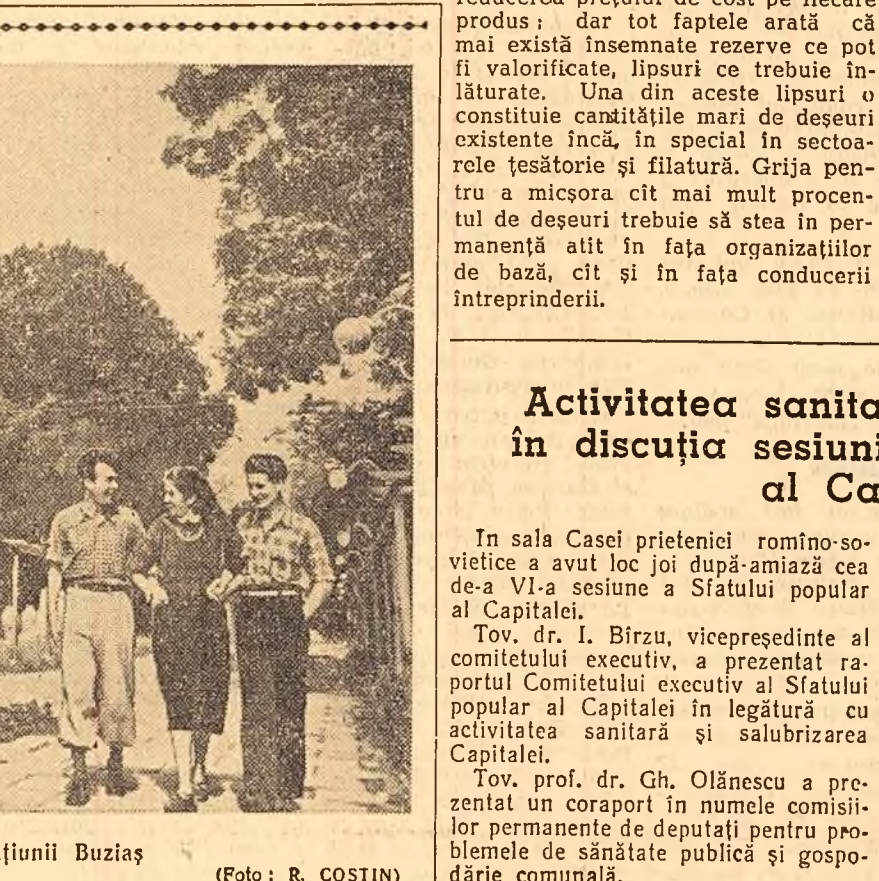
În parcul stațiunii Buziaș

ORAȘUL STALIN (coresp. „Scînteii”). — Colectivul întreprinderii „Partizanul Roșu” din Orașul Stalin, însușindu-și inițiativa metalurgistilor de la uzinele „I. C. Frimu”-Sinaia, s-a angajat ca prin reducerea prețului de cost să obțină beneficii peste plan în valoare de 370.000 lei. Muncitorii și tehnicienii de aici și-au propus să sporească productivitatea muncii cu 3% față de plan, să reducă cheltuielile de fabricație prin justa folosire a coloranților și chimicilor și reducerea deșeurilor etc.