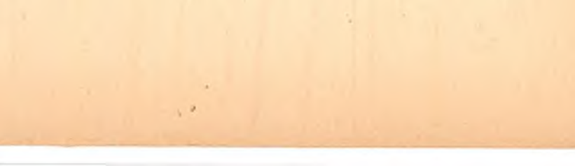
La Teatrul Național din București se va reprezenta, pentru prima oară în țara noastră, „Furtuna” de Shakespeare.