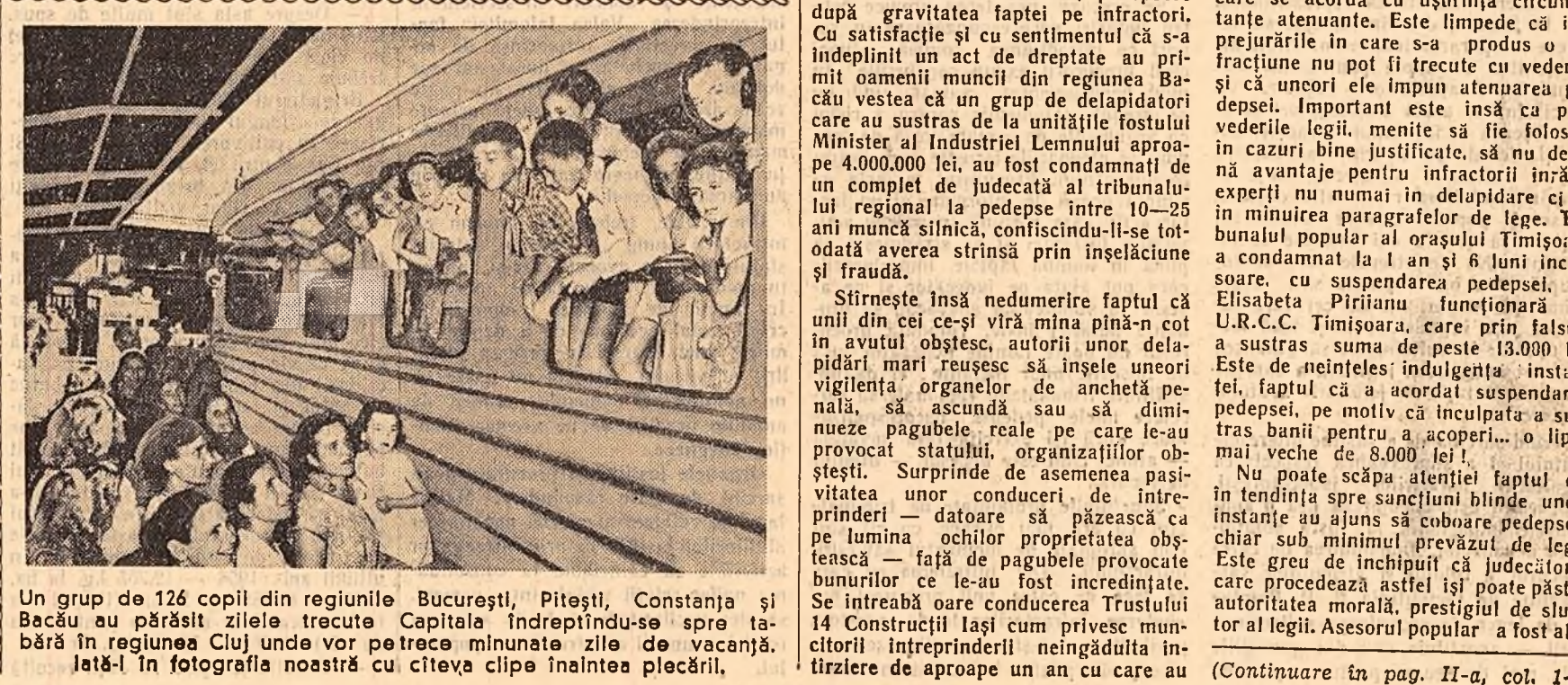
Un grup de 126 copii din regiunile București, Pitești, Constanța și Bacău au părăsit zilele trecute Capitala îndreptîndu-se spre tabără în regiunea Cluj unde vor petrece minunate zile de vacanță. Iată-l în fotografia noastră cu cîteva clipe înaltea plecării.

cale ferată, a avut un ecou adinc în marea inimă a poporului. Totodată, oamenii muncii disprețuiesc și urăsc pe jefuitorii avutului obștesc. Cum să nu ciocotească de delapidatori, hoji, șperțari, cum să nu socotească dușmanii al bunului lor trai, cînd prin faptele lor aceștia își bat joc de truda oamenilor muncii, de eforturile și sacrificiile lor pentru fătura unei vieți mai bune? Acela cînești din care se plătesc salariile și se ridică construcții sociale-culturale fac parte integrantă din marea avuție obștescă, a cărei apărare și dezvoltare constituie o cauză vitală a tuturor oamenilor muncii. Căci toate aceste bunuri cuprind o parte din rodul strădănilor fiecărui muncitor, țărăn muncitor, intelectual. Crește tot mai mult și capătă o importanță tot mai mare avutul obștesc al gospodăriilor colective, cooperativelor de producție agricolă și cooperativelor de consum, pentru întărirea acestor unități socialiste și îmbunătățirea tralului membrilor lor. Avînd un rol hotărît în asigurarea progresului necontenit al țării, avutul obștesc este temelia sfîntă și intangibilă a orînduirii noastre, a făturii unui trai mai bun. Se bucură de prețuirea și stima întregului popor slujbașii cinstiți ai statului care veghează cu strînicie la păstrarea bunului obștesc. Bravura ceterărilor Nicolae Dancti, care și-a dat viața în mod eroid apărînd banii publici și împiedicînd o catastrofă de