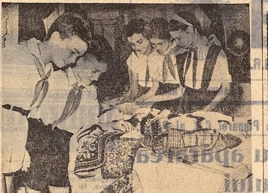
La Palatul Pionierilor din Capitală s-a deschis vineri o expoziție cuprinzînd peste 7.500 cadouri care vor fi duse de delegații țării noastre la Moscova, pentru a fi dăruite participanților la Festival. În clipă: un grup de pionieri admirînd curăsurile expuse.

Camere luminoase și elegant mobilate, un cabinet medical bine utilitat, farmacie bine aprovizionată cu medicamente, un club cu aparat de radio și televizor, o bibliotecă cu peste 2.000 volume, sală de mese curată și