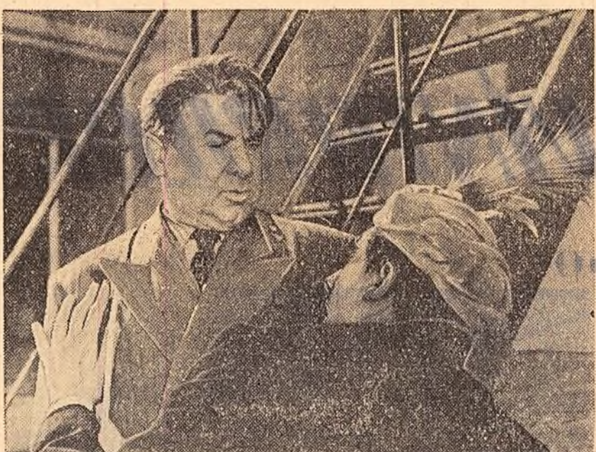
Pe ecranele Capitalei rulează de câteva zile filmul „Noaptea carnavalului”, o producție a studiourilor sovietice...

Din volumul „Lupta cu ineria”, care va apărea în „Editura Tineretului”