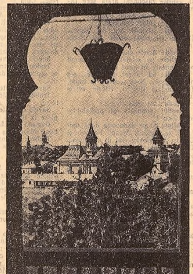
Vedere din Suceava