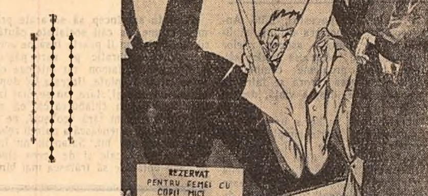
Omul și umbra (Desen de ȘTE-FAN MIRON).