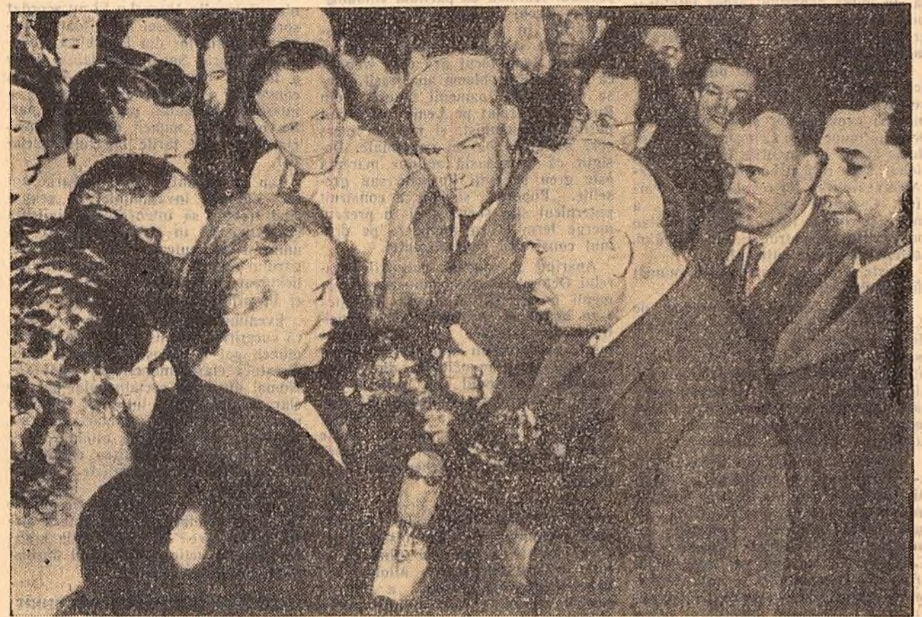
N. S. Hrușciov și N. A. Bulganin stind de vorbă cu sătenii din satul Hyn.

Cehoslovacia, a spus în continuare tov. Hrușciov, este o țară cu un nivel înalt al agriculturii. Noi avem mult pământ și învingem prin suprafață. Dar do. învingeți prin puterile caracterului intens al gospodăriei. Am recunoscut și recunoaștem aceasta. Dar și dv. aveți ceva în viața de colhozurile și sovhozurile noastre fruntașe.