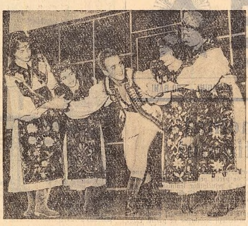
Dans bănjoane, executat de membri ai echipei de dansuri a C.C. al U.T.M. — una dintre ambasadorele jocurilor noastre naționale la Festivalul de la Moscova.

Studierea și dezbaterile documentelor pleranei C.C. din 28 iunie — 3 iulie 1957 vor înarma și mai puternic organizațiile de partid și pe fiecare membru de partid în lupta pentru întărirea continuă a partidului și a rolului său conducător, pentru sporirea capacității partidului de organizare și mobilizare a maselor în vederea victoriei depline a socialismului în patria noastră.