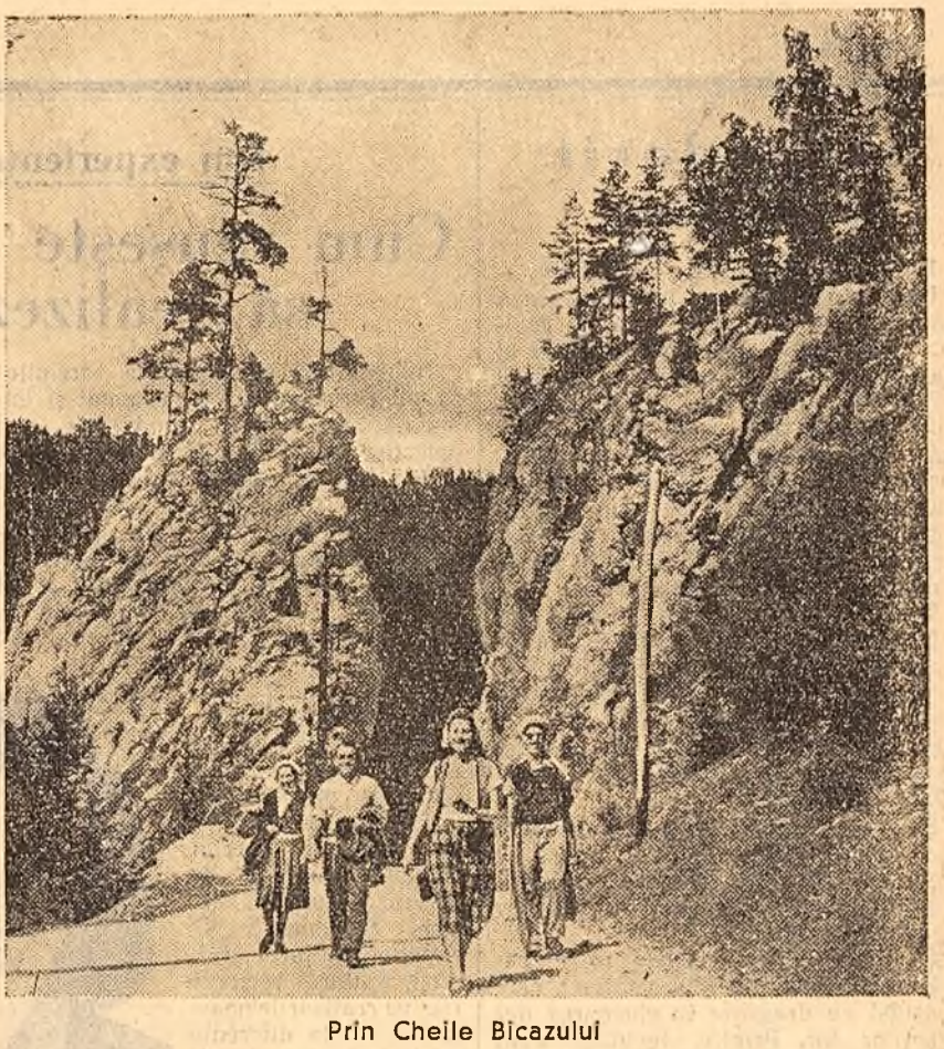
Prin Cheile Bicazului

TELEGRAMĂ Excelenței Sale Dr. PETRU GROZA președintele Prezidiului Marii Adunări Naționale a Republicii Populare Romine București Binevoitorul mesaj pe care mi l-a adresat Excelența Voastră cu ocazia zilei de 14 iulie mi-a produs o mare bucurie. Exprim Excelenței Voastre, odată cu mulțimiile mele, urări pentru fericirea dvs. și a poporului român. RENÉ COTY Președintele Republicii Franceze