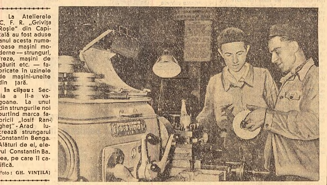
La Atelierele C. F. R. „Grivița Roșie” din Capitală au fost aduse anul acesta numeroase mașini moderne — strunguri, freze, mașini de găurit etc. — fabricate în uzinele de mașini-unelte din țară.

În întreaga țară secerișul e în toi. Acolo unde, cu câteva zile în urmă, încă mai unduiau lanurile bogate în rod, au apărut șiruri nesfârșite de clăi așezate pe miriște. În regiunea București, în sectorul cooperatist și individual, secerișul s-a terminat. De asemenea, în regiunile Craiova, Timișoara, Constanța și a secerișul se apropie de sfârșit. În multe locuri a început și treieriișul. Cu bucurie privesc rodul bogat al muncii lor colectivității din Gighera-Craiova, care au obținut 2.000 kg. grâu la ha, cei din comuna Movila Miresei-Galați, care au cules 2.560 kg. grâu la ha, muncitorii gospodăriilor de stat Chirlogi, Minăstirea, Călărăși, care au strâns între 2.300—2.500 kg. grâu la ha.