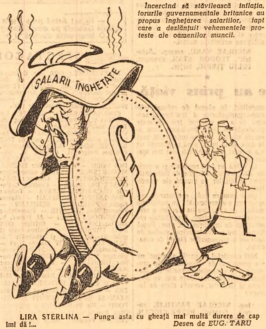
LIRA STERLINĂ — Punga asta cu gheață mai multă durere de cap îmi dă!... Desen de EUG. TARU