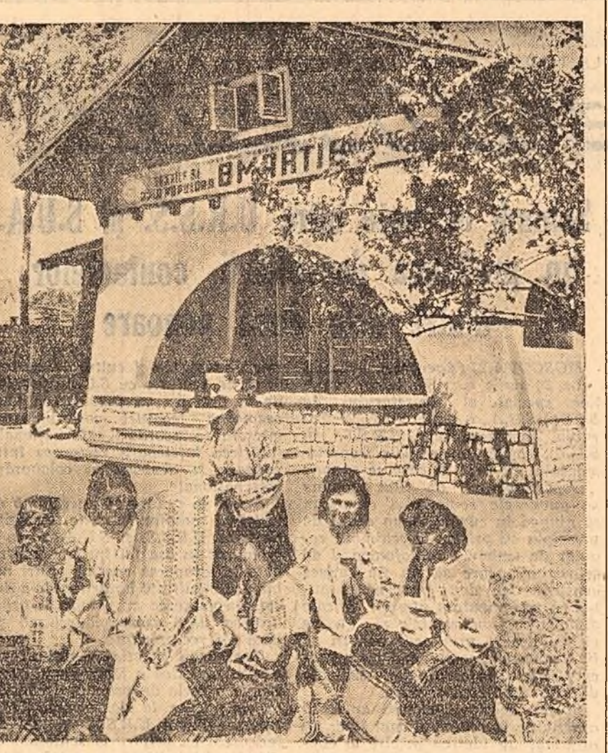
Cooperativa „8 Martie” din Breaza e renumită în întreaga țară pentru frumusețea cuscăturilor naționale, lucrate cu mult gust de iscusitele cusătoare. Iată-le la lucru.