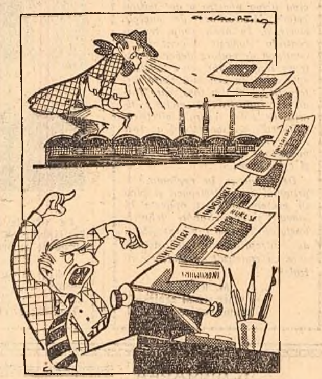
Cind e în inspecție, TACE... Cind se-ntorce la birou, FACE...

Există delegați din ministere care, pe teren, în întreprinderi, nu semnalează nimic. Rein-