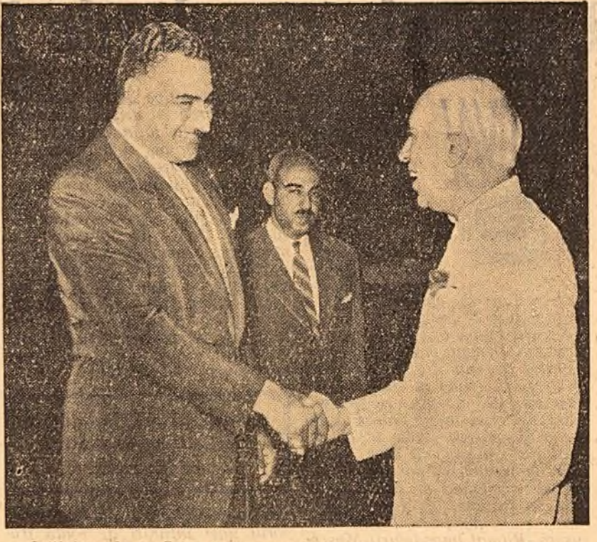
Întîlnirea de la Cairo între președintele Nasser și premierul Nehru