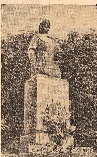
Monumentul lui N. Grigorescu