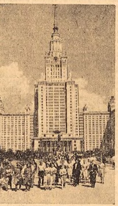
Tineri și tineri, participanți la Festivalul și ziua Universității de stat „Lomonosov” din Moscova.