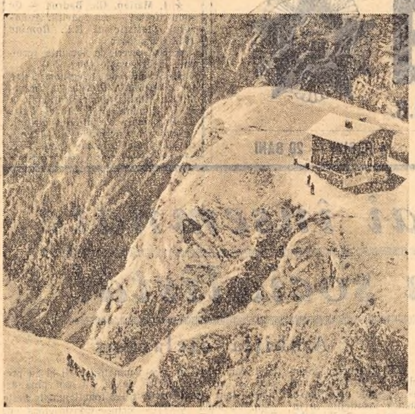
Frumusețile patriei: Munții Bucegi — Cabana Caralman

„La temperatură înaltă” În ziarul „Știința” a fost publicată o notă sub titlul de mai sus, în care se critică atitudinea delăsătoare a unor organe locale față de terminarea construcției cinematografului din Rm. Sărat.