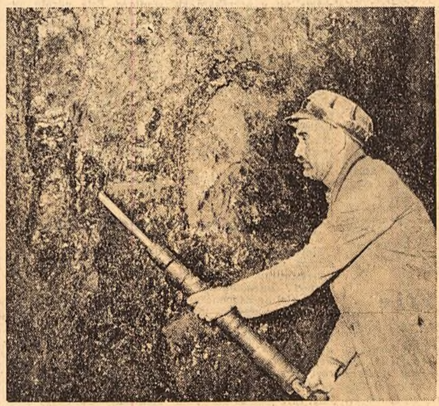
În cadrul întrecerii, colectivul sectorului 5 sud — sector frunzaș la mina Lupeni — extras, de la începutul anului și până la 1 august...

kg. fire lucrate peste plan se pot țese 50.000 m.p. stambă.