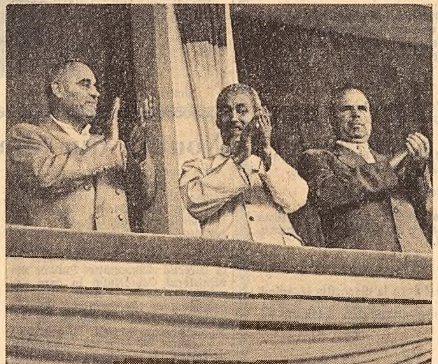
La tribuna tovarășii Gh. Gheorghiu-Dej, Ho Și Min și Chivu Stoica răspund prin aplauze aclamațiilor mulțimii.

După miting pe stadion au urmat concursuri sportive la care au luat parte sportivi fruntași ai țării noastre.