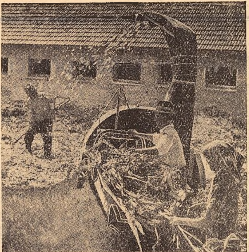
Pentru asigurarea hranei animalelor, în gospodăria agricolă de stat Brașduri se vor însiloza în acest an 4000 tone furaje. Prină de acum s-au însilozat peste 1000 tone.

Construcții Trustului 14 Iași și-au luat angajamentul să dea în folosință sala de concerte în cinstea celei de-a 40-a aniversării a Marii Revoluții Socialiste din Octombrie. Pentru această lucrare au fost investite aproape 7 milioane lei. (Agerpres)