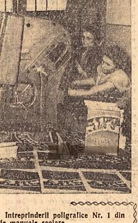
Și în această toamnă, colectivul întreprinderii poligrafice Nr. 1 din Capitală va tipări noi sute de manuale școlare. În clișeu: Sînt gata primele manuale.

MARIN ROTĂRU RADU ATANASESCU (Continuare în pag. II-a, col. 6-7)