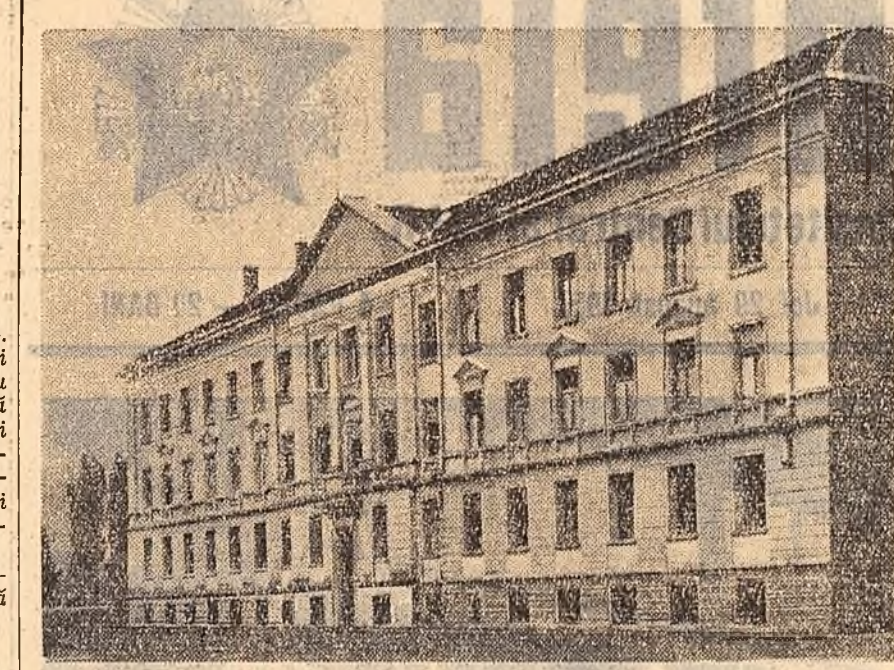
În anii puterii populare în Valea Jiului au fost construite și date în folosință un mare număr de unități social-culturale. În cliseu: Noua clădire a spitalului din Lupeni.