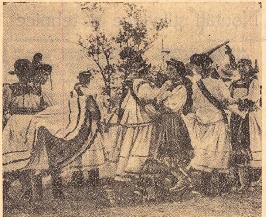
Frumoase sint portul și dansurile din Țara Oașului. Iată un grup de „cuconi” și fete din Negrești în timpul unui vjelijos dans oșan. Păcat că nu puteți auzi jipuriturile hăcăilor (strigături hazlii)

*) Fragment din romanul „Valea Fierului”, vol. II, — în manuscris.