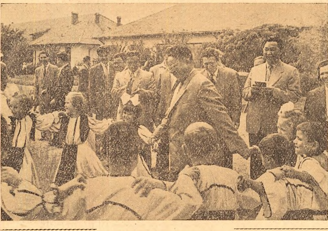
În cursul vizitelor pe care o fac în țara noastră, solii poporului mongol sînt întâmpinați pretutindeni cu dragoste...