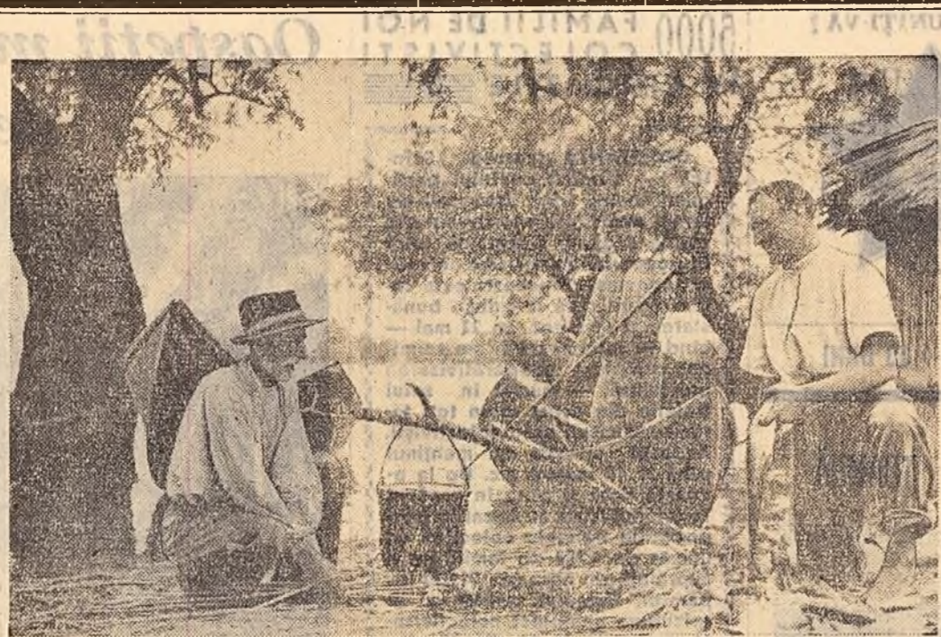
După muncă, o masă bună. Primul fel tradiționalul bors pescăresc.