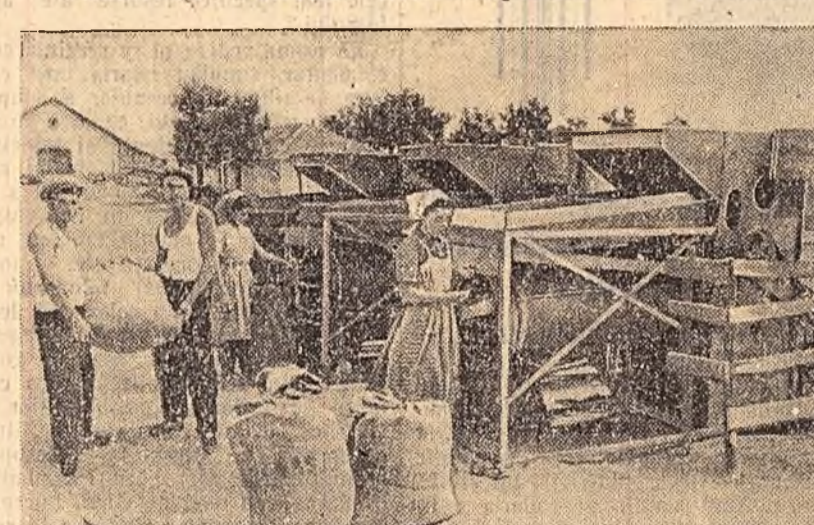
La gospodăria agricolă de stat „Justin Georgeescu” din regiunea Galați se fac intense pregătiri pentru însămînțările de toamnă. În timp ce tractorii pregătesc ogorul, alți muncitori fac selecția și tratarea semințelor. În clișeu: Muncitorii gospodăriei executînd selecția grîului cu ajutorul unui cuplu de 3 selectoare acționate de un tractor.