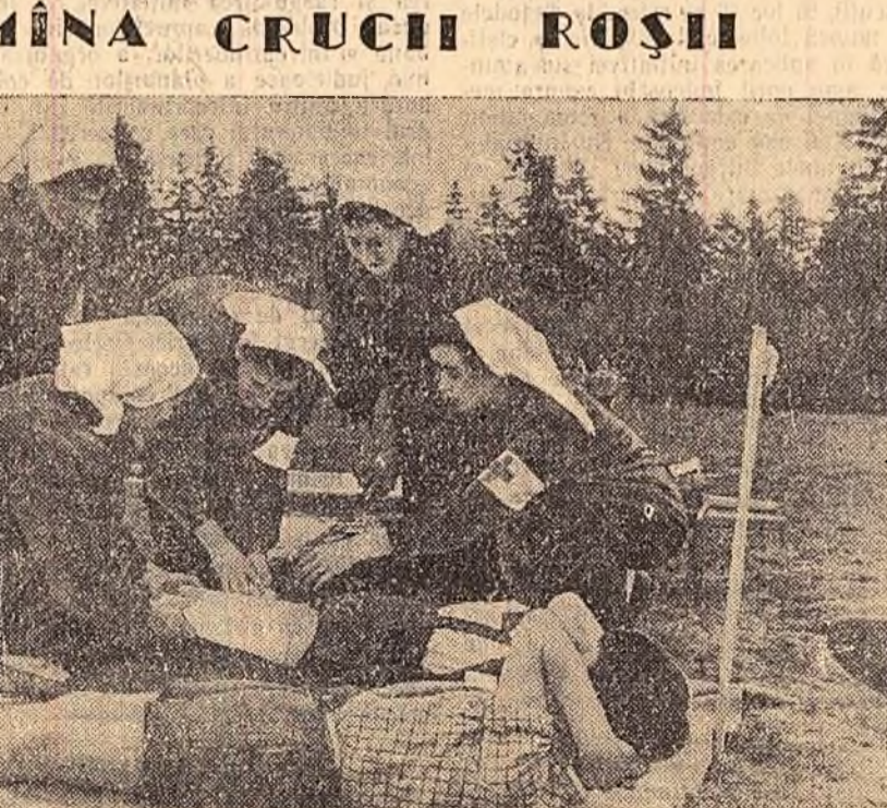
In clișeu: Exerciții practice cu ocazia desfășurării probelor sanitare în mediul sătesc.