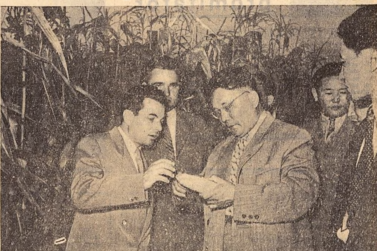
In vizită la Institutul de cercetări pentru cultura porumbului de la Fundulea