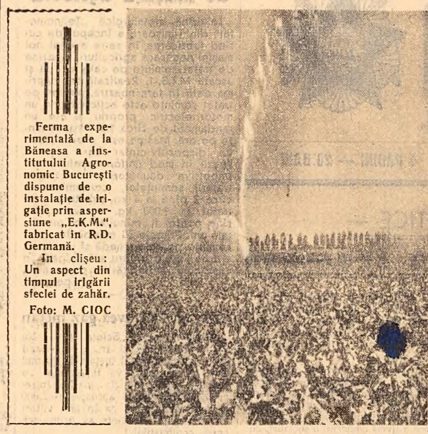
Forma experimentală de la Bimensa a Institutului Agronomic Bucureşti dispune de o instalaţie de irigaţie prin aspersiune „E.K.M.”, fabricat în R.D. Germană.