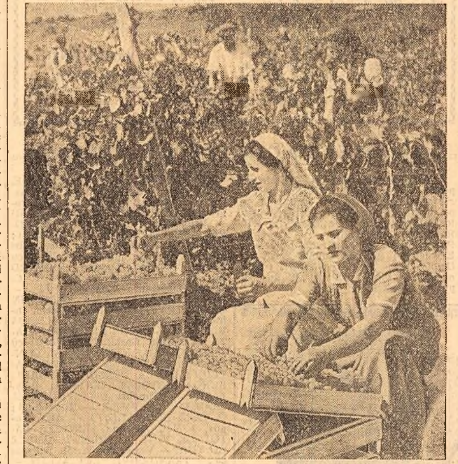
Culesul vîilor prilejește multe bucurii în fiecare toamnă. Și în acest an muncitorii și tehnicienii de la G.A.S. Panclu, regiunea Galați, au obținut o recoltă bogată de struguri. În clișeu: Strugurii recoltați sînt sortați cu grijă pentru a fi trimiși pe piață.

Președintele Consiliului de Miniștri al R. P. Romîne, tovarășul Chivu Stoica, a adresat un mesaj șefilor de guvern ai Albaniei, Bulgariei, Greciei, Iugoslaviei și Turciei. Mesajul președintelui Consiliului de Miniștri al Romîniei tratează importante probleme privind relațiile între țările din Balcani. Mesajele au fost predate de către ambasadorii Republicii Populare Romine în țările respective.