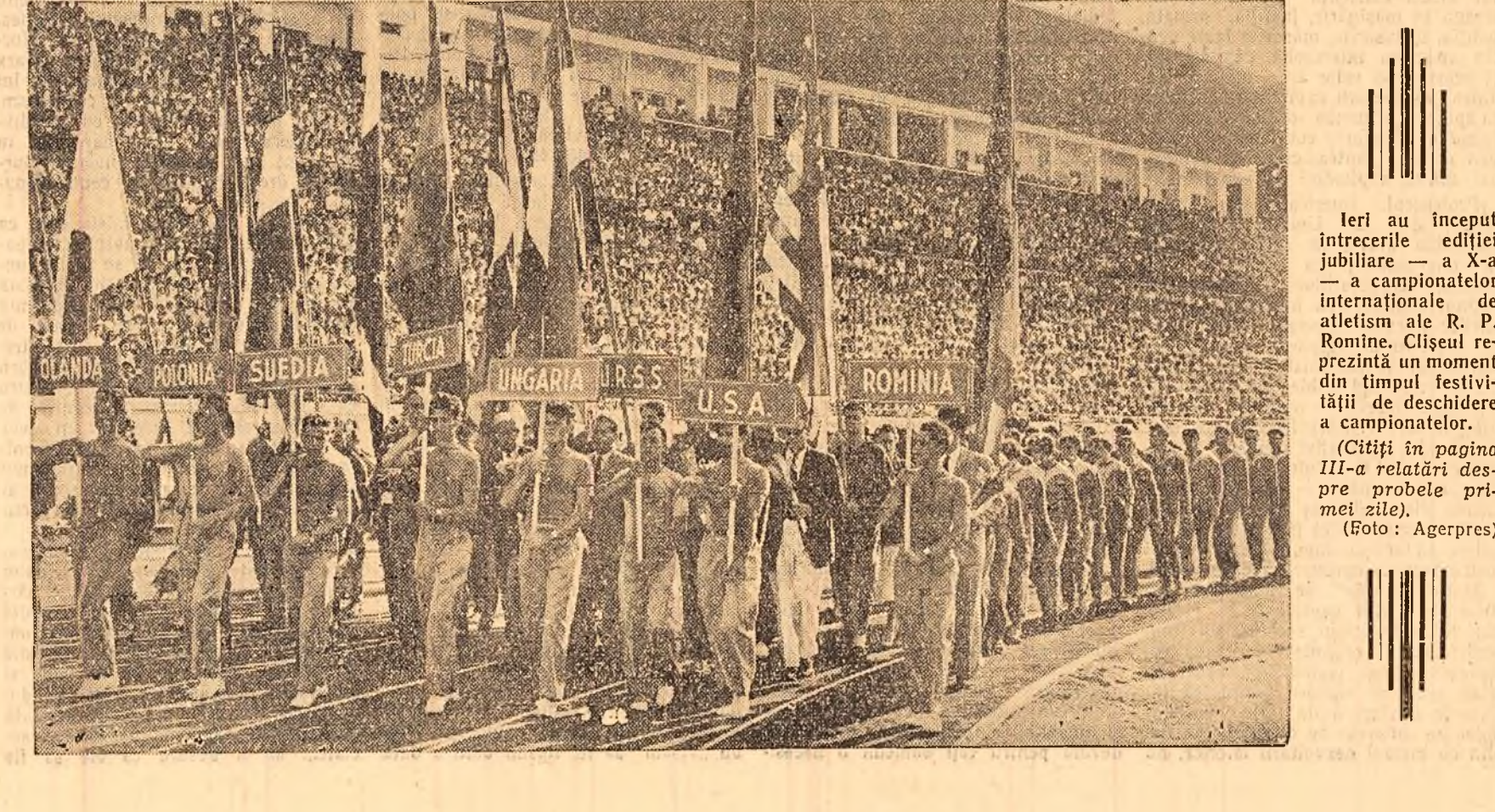
Ieri au început întrecerile ediției jubiliare — a X-a — a campionatelor internaționale de atletism ale R. P. Romine. Clișeu reprezentînd un moment din timpul festivității de deschidere a campionatelor. (Citiți în pagina III-a relații despre probele primelor zile.)

CAIRO 14 (Agerpres). — La 12 septembrie, deasupra zonei militere interzise în apropiere de Cairo a fost observat un avion american cvadrimotor. Avionul a fost avertizat prin radio că se află în zona interzisă. Pilotul nu a ținut însă seama de acest avertisment și avionul a continuat să se rotească la o înălțime mică cu scopul evident de reconșterea. Atunci forțele militare aeriene egiptene au silit avionul să aterizeze pe aeroportul din Cairo. În avion se afla un grup de ofițeri americani. Pe bordul avionului au fost descoperite un aparat de fotografiat și o trusă de filme. Autoritățile egiptene au confiscat aparatul și trusa de filme și, după cercetările corespunzătoare, au permis avionului american să părăsească a doua zi teritoriul Egiptului.