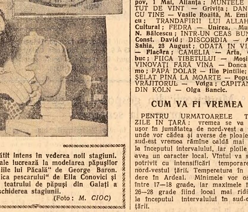
Teatrul de păpuși din Galați s-a pregătit intens în vederea noului stagiuni. În clipse: Sculptorul Pezollă și Pașculea lucrează la modelarea păpușilor pentru piesa în pregătire „Năzdrăvăniile lui Păcălă” de George Baron.