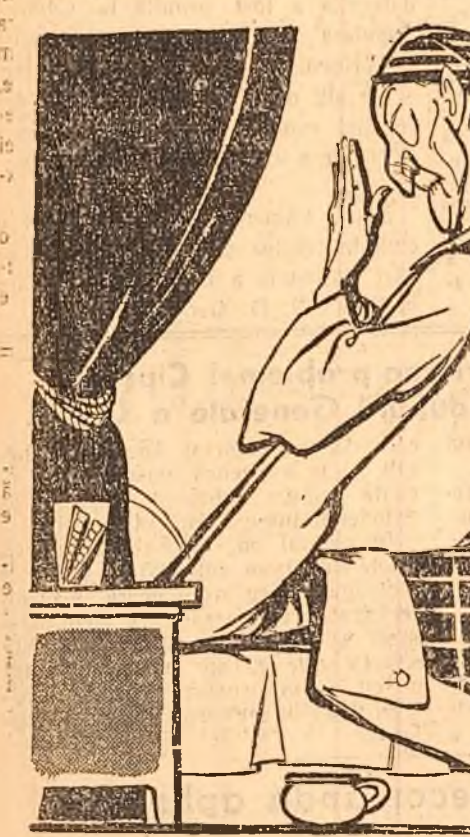
ADENAUER: — Dă-mi doamne ajutor, că mister Dules și marele nostru capital mă ajută fără să-mi rog! Desen de EUG. TARU