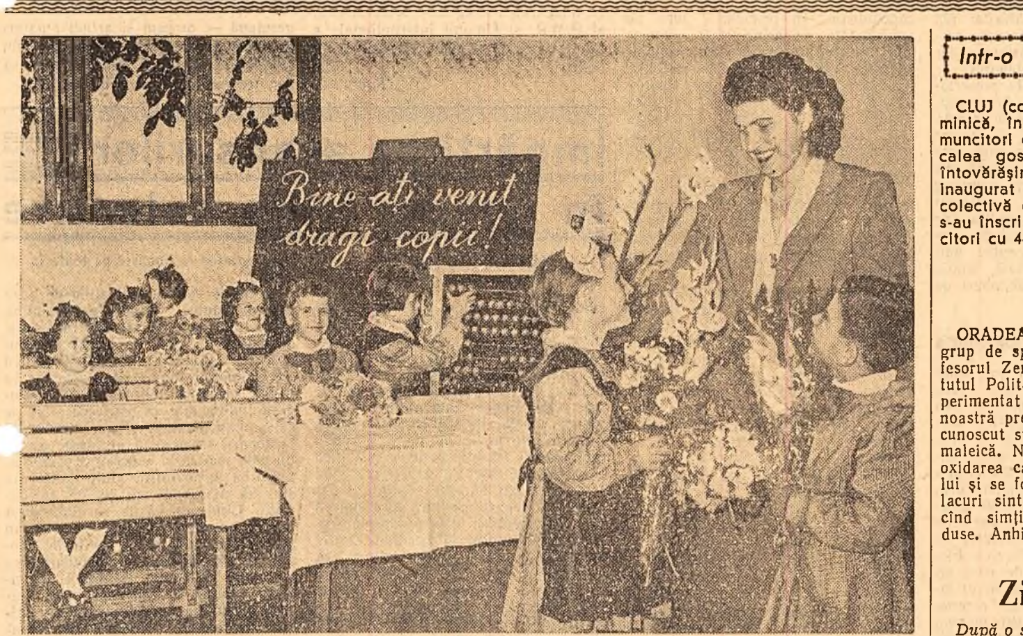
Ieri, școlile din țară și-au deschis uși. Pline de bucurie au fost revederile elevilor cu profesorii, în înclîș: Prima zi de cursuri a clasei I-a a Școlii medii nr. 4 din Ploști.

SUKARNO Președintele Republicii Indonezia