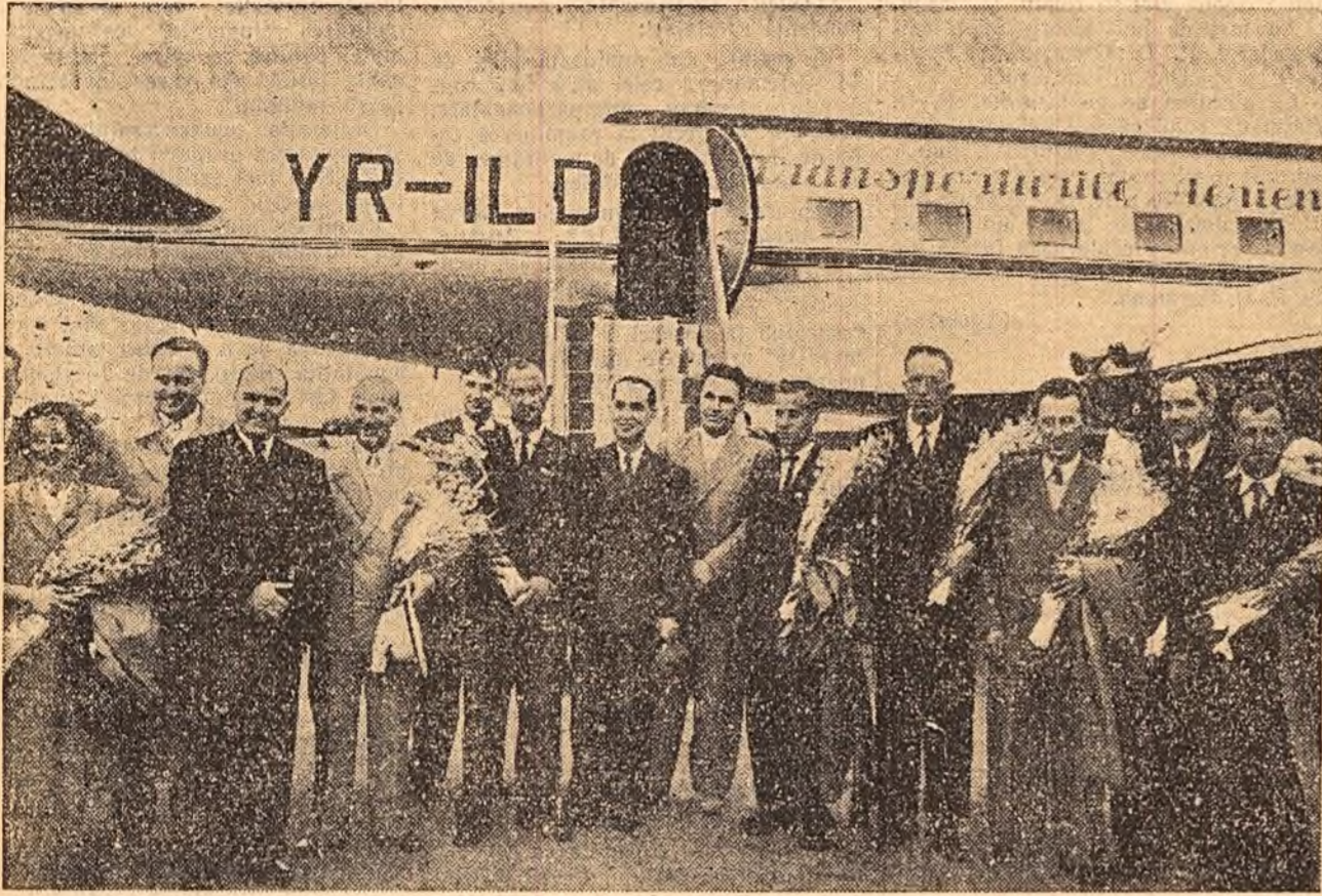
La sosire pe aeroportul Băneasa