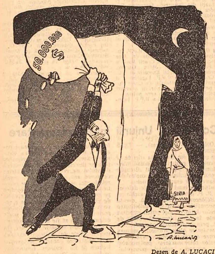
Desen de A. LUCACI

S.U.A. au alocat 50.000.000 dolari în vederea subjugării Siriei.