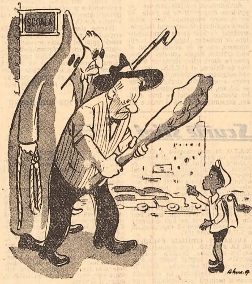
— Vă rog, aici se învață drepturile omului? Desen de A. LUCACI