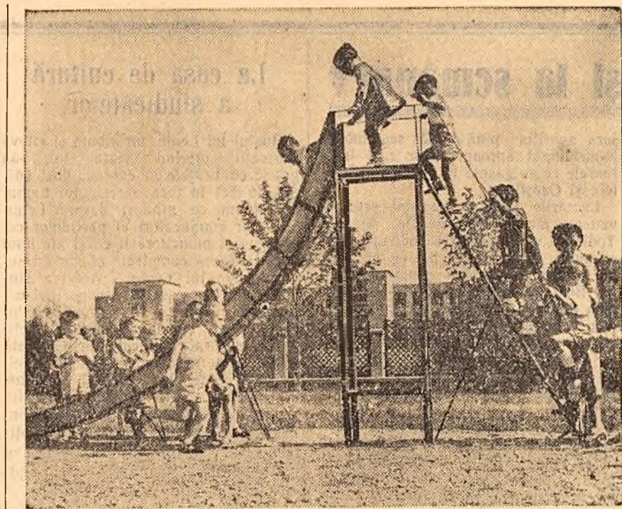
Toboganul e una din distracțiile favorite ale copiilor de la cîmînul de zi al fabricii de confecții „Gh. Gheorghiu-Dej”. Profitînd de zilele însorite și plăcute de toamnă, picii muncitorilor din fabrică, unii mai „jefiți”, alții cu inima cit un bob de muștar, se aventurează, chicotind de bucurie și emoție pe șanțul teribil de inclinat.