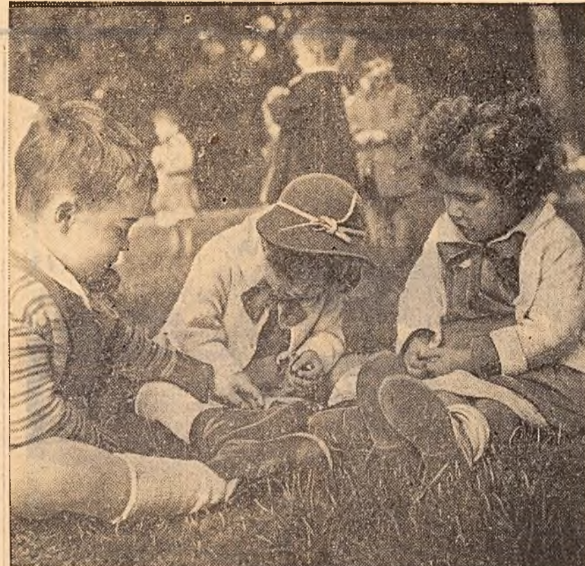
Toamnă trîzie și plăcută... Copiii de la cîmpul fabricii de bere „Rahova” au făcut o plimbare la pădurea Băneasa. Trei prichindei, pe tarab, își împart cu atenție grămjoara de ghindă. Se pare că împărțirea decurge fără incidente.

Căror cauze se datorează această situație? În loc să ducă o intensă muncă de lămurire în vederea grăbirii culesului porumbului și eliberării terenului de coceni, secția agricolă a sfatului popu-