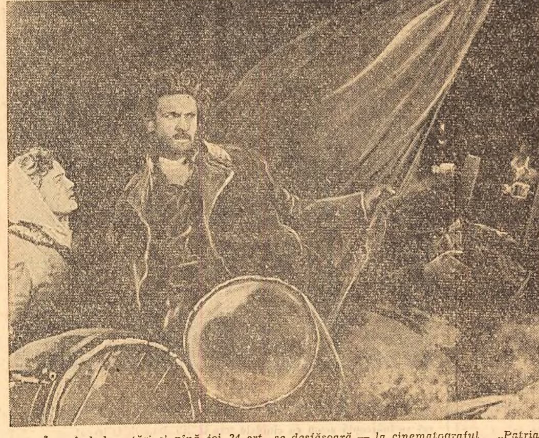
Începînd de astăzi și pînă joi 24 crt., se desfășoară — la cinematograful „Patria” — Festivalul Filmului Sovietic. În clișeu: O scenă din filmul „Prologul”, realizare în culori pentru ecran lat și cu sunet stereofonic — film care va fi prezentat astăzi cu prilejul deschiderii Festivalului.