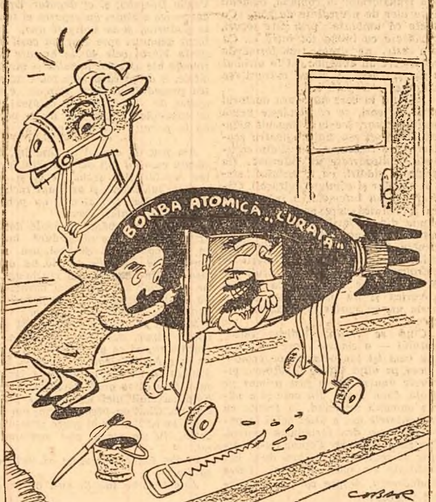
Desen de NELL COBAR

Propaganda cu privire la bomba atomică „curată” este necesară S.U.A. pentru a înșela opinia publică, „Justificînd” războiul atomic.