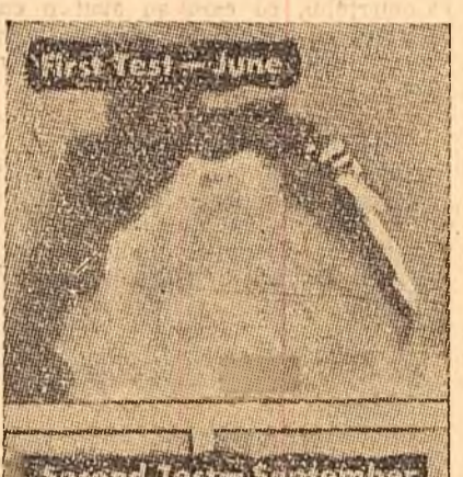
Cliseul reproduș din revista americană „Newsweek” reprezintă cele două eșecuri înregistrate la experimentarea rachetelor americane Atlas, în lunie și septembrie a.c.

MOSCOVA 17 (Agerpres). — TASS La 16 octombrie a fost organizată în Sala Coloanelor din Casa Sindicatelor o reuniune consacrată lansării primului satelit artificial al pământului.