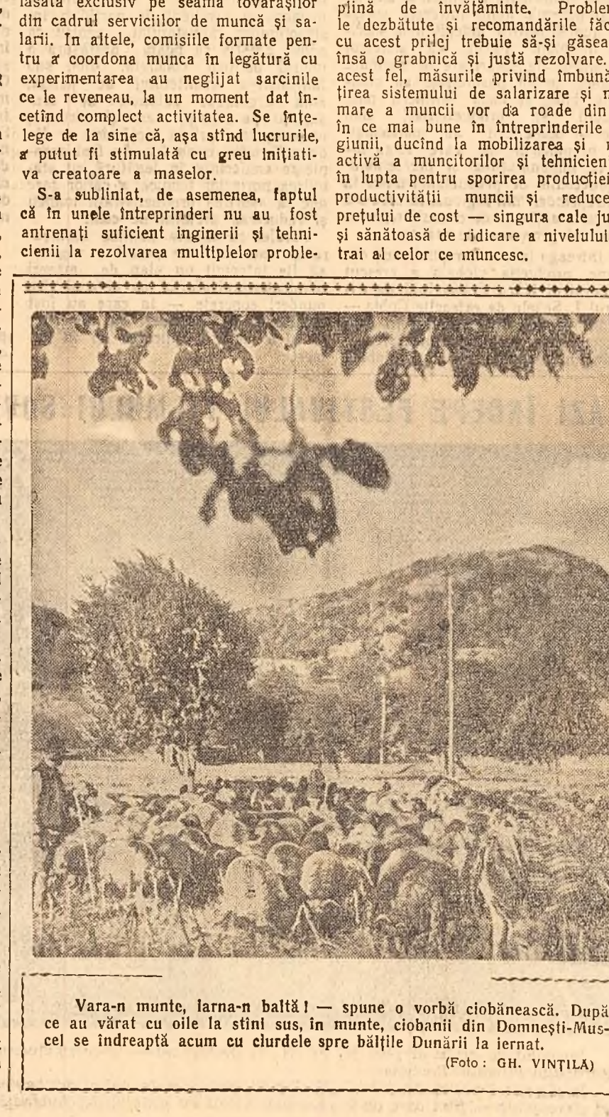
Vara-n munte, iarna-n bălță! — spune o vorbă cîmbănească. După ce au vîrat cu oile la stîni sus, în munte, cîobanii din Domnești-Muscel se îndreaptă acum cu ciurdele spre bălțile Dunării la iernat.