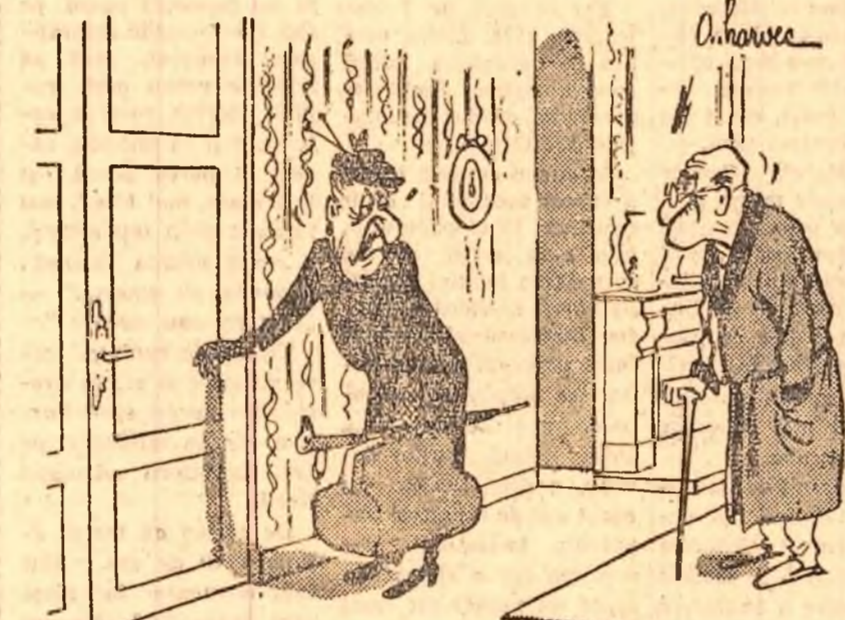
Intre noi totul s-a terminat. Mă întorc la mama.