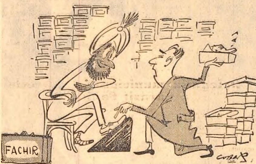
FACHIR. - Cum vă simții în pantofii aceștia? FACHIRUL: - Perfect! Pantofii de piele și plin de cule! (Desen de NELL COBAR)

Zilele trecute, un medic de la clinica veterinară din Dresda (R.D.G.) a avut un pacient rar întîlnit. Singurul boa constrictor aflat la grădina zoologică a orașului a fost operat de o tumoare de mărimea unei nucii. Șarpele a fost operat pe o masă instalată în cușca sa. Cinci persoane au imobilizat reptila în timpul operației.