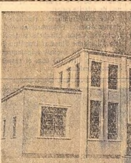
De curind la uzina metalurgică „Unio” din Satu Mare a intrat în producție noua secție de oxigen. În clădire: Exteriorul secției anexe de fabricare a oxigenului.