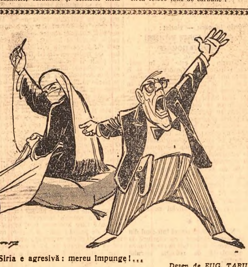
— Siria e agresivă: mereu împunge!... Desen de EUG. TARU