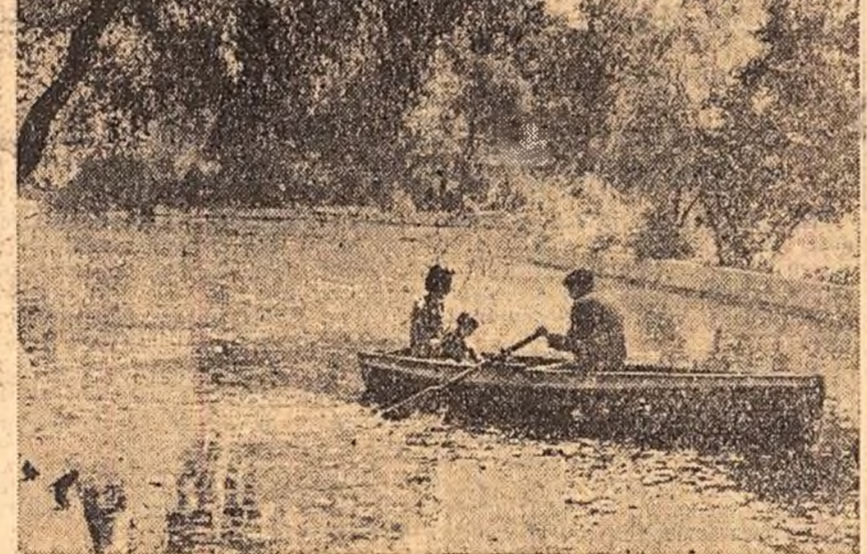
Toamna în Cîmpulung

Print-o mai bună organizare a muncii și a procesului tehnologic în această uzină s-au economisit, numai în trimestrul III al anului, 12.000 kg. bumbac puf, din care se pot țese 50.000 m.p. țesături. În ultimele luni s-au introdus în fabricație 11 desene noi, de diferite culori.