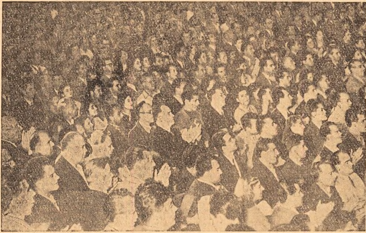
Eri a avut loc în sala Floreasca un mare miting al oamenilor muncii și al activității sindicale din Capitală, consacrat lucrărilor celui de-al IV-lea Congres Mondial al Sindicatelor, care a avut loc la Leipzig între 14-15 octombrie. La miting au luat cuvîntul tov. Gh. Apostol, președintele C.C.S., care a prezentat o dare de seamă asupra lucrărilor Congresului, precum și reprezentanți ai unor sindicate de peste hotare. În clișeu: Un aspect din sală.