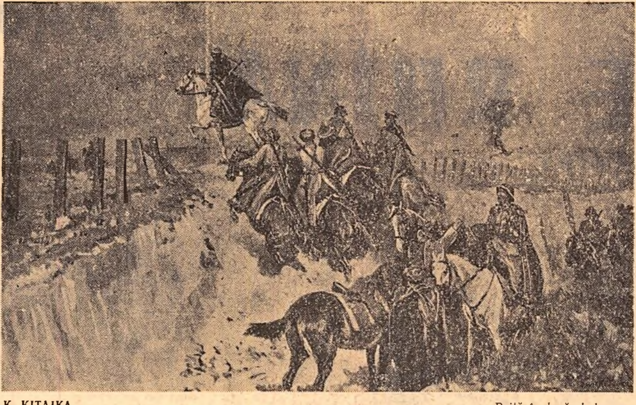
K. KITAIKA (Din expoziția de grafică sovietică) Raită în lașarul dușman

Lenin a plecat? Acum cînd visul lui ocolește Globul înaripat iar stelele lui scilpesc peste orice casă? Cine-ar putea crede? Lenin trăiește! N-a fost nici un lanuarie, n-a fost nici o seară atît de dureroasă.