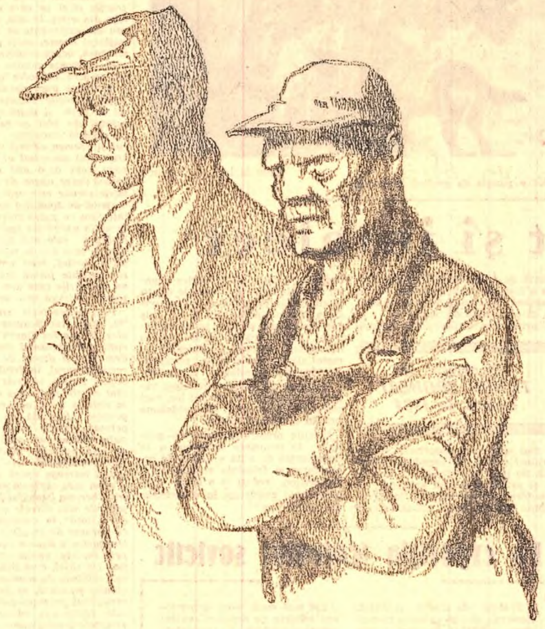
Desen de EUGEN TARU

Și trece, z și noapte, talazul ce cuprinde de socoteli și cifre exacte un petop, (Reprodus din „Contemporanul” nr. 41).