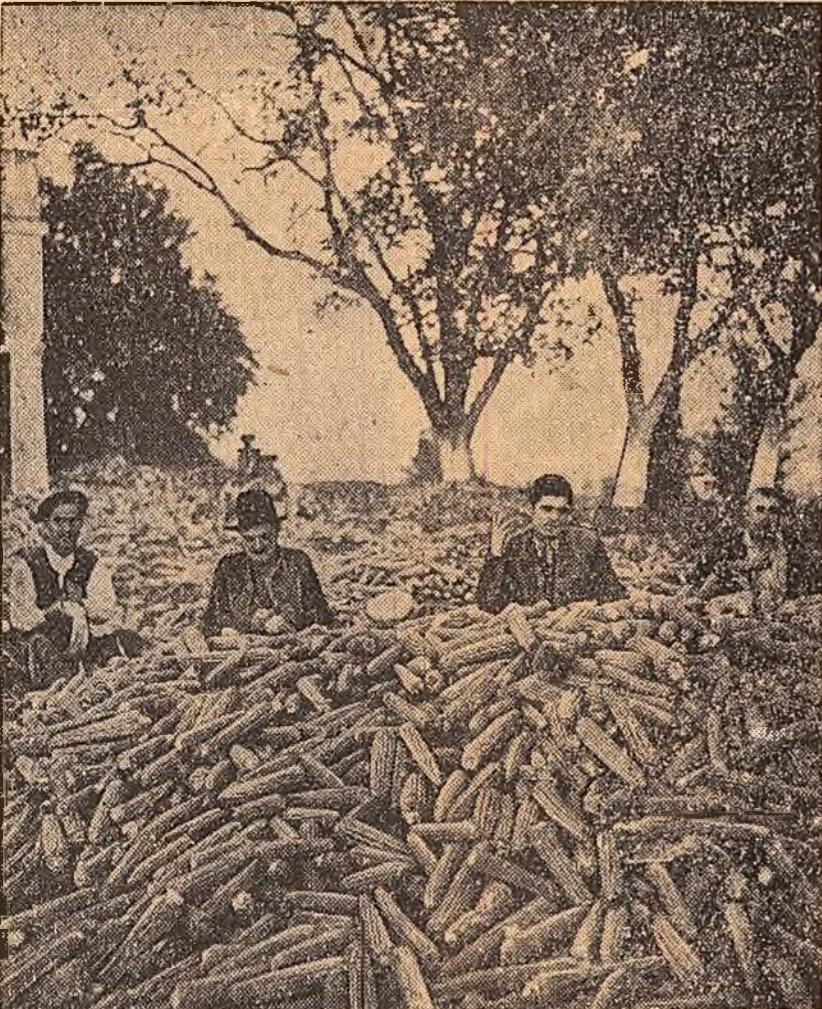
Gospodăria colectivă „Răsărit de soare” din Strelești, raionul Drăgășani, a obținut o producție bună de porumb: 4000 kg. știuleți la ha. În clișeu: se face curățatul știuleților.