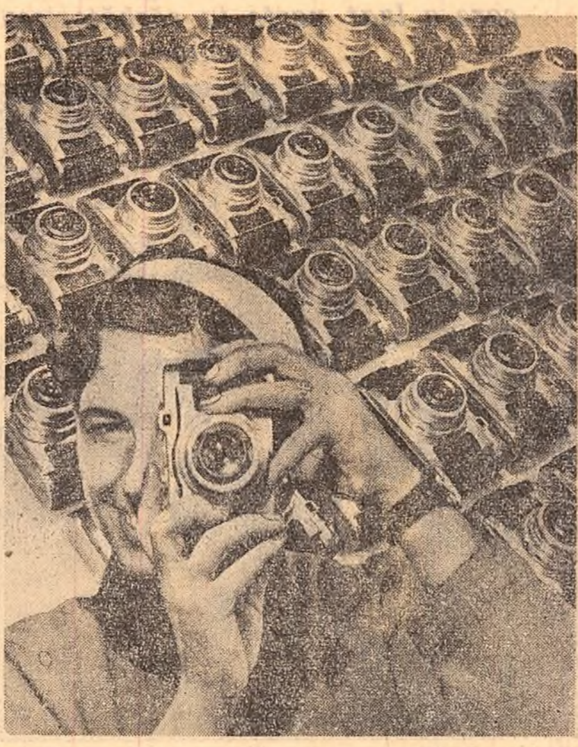
Muncitorii și tehnicienii de la „Întreprinderea optică română“ din Capitală au realizat noul tip de aparat fotografic „Orizont“...