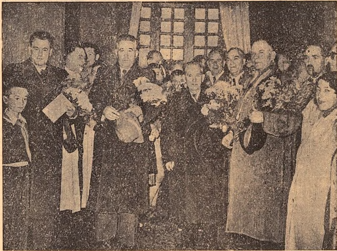
Membrii delegației sovietice la plecarea, în Gara de Nord