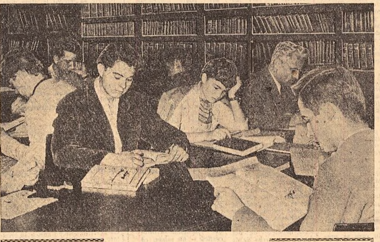
Lucrările literare, științifice și tehnice aflate în marea bibliotecă A.R.L.U.S. din Capitală sînt consultate zilnic de zeci și sute de studenți, ingineri, profesori, tehnicieni și muncitori. În clișeu: Un colț al sălii de lectură.