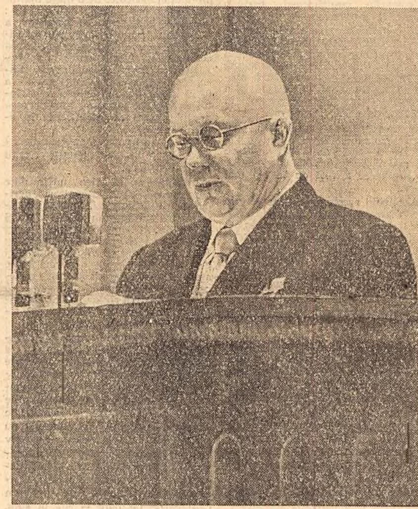
Tovarășul N. S. Hrușciov rostindu-și raportul

Trăiască Partidul Comunist al Uniunii Sovietice în frunte cu Comitetul său Central! Trăiască frăția oamenilor muncii din toate țările, unitatea și coeziunea de nezdruccinat a partidelor comuniste și muncitorești sub steagul marxism-leninismului! Trăiască pacea între toate popoarele lumii!