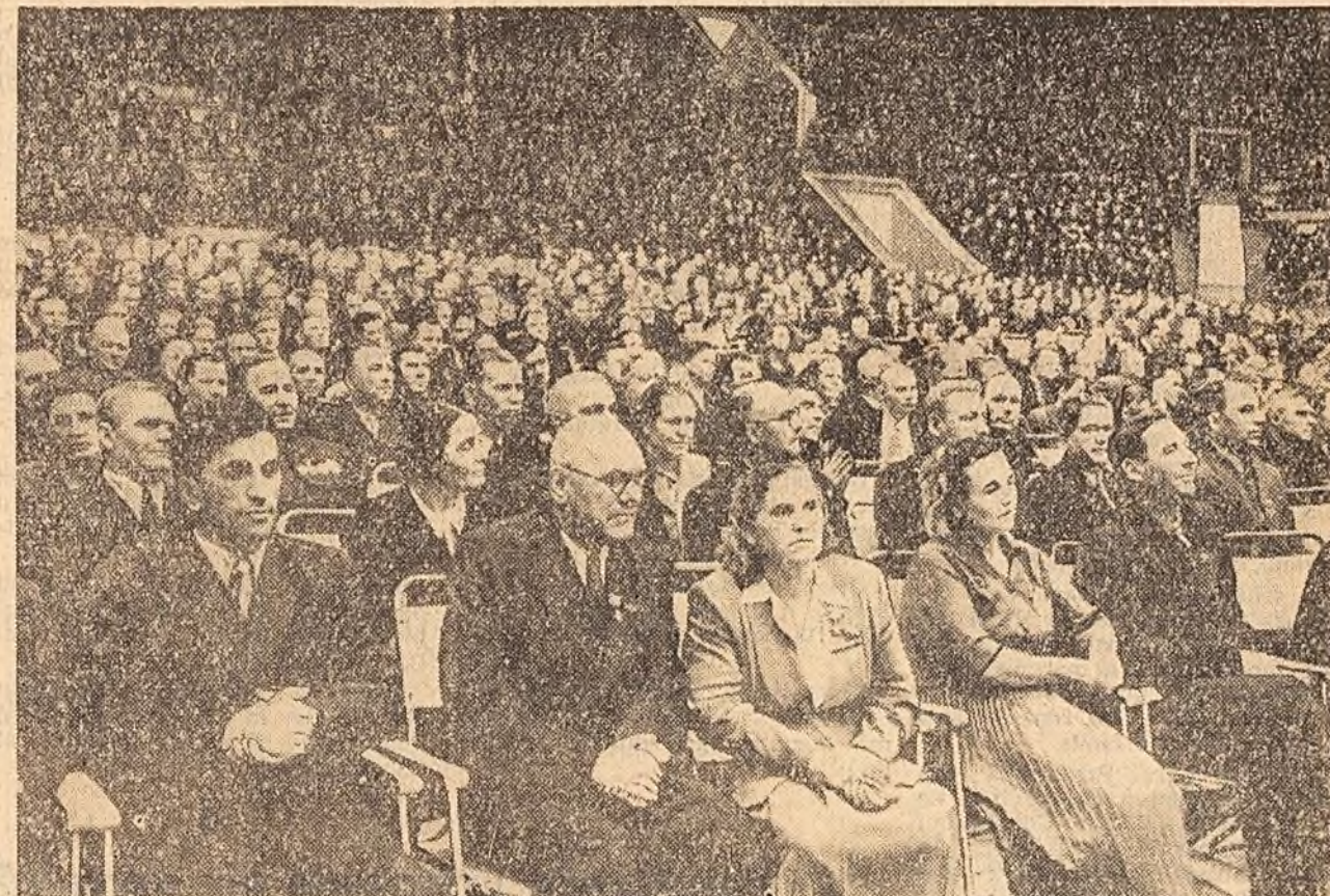
Asistența la sesiunea jubiliară a Sovietului Suprem al U.R.S.S. consacrată celei de-a 40-a aniversări a Marii Revoluții Socialiste din Octombrie, se siune care a avut loc ieri în Palatul sporturilor din Lujniki.

Poporul sovietic a simțit întotdeauna și simte sprijinul frățesc, prietenesc din partea proletariatului internațional, din partea milioane de oameni ai muncii din lumea întreagă. Rupind prima frontul imperialismului, în anul 1917, construid socialismul, zdrobind mașina de război hitleristă, țara noastră și-a îndeplinit cu cinste datoria ei internațională față de omenii muncii din toate țările, față de mișcarea comunistă și muncitorească interna-