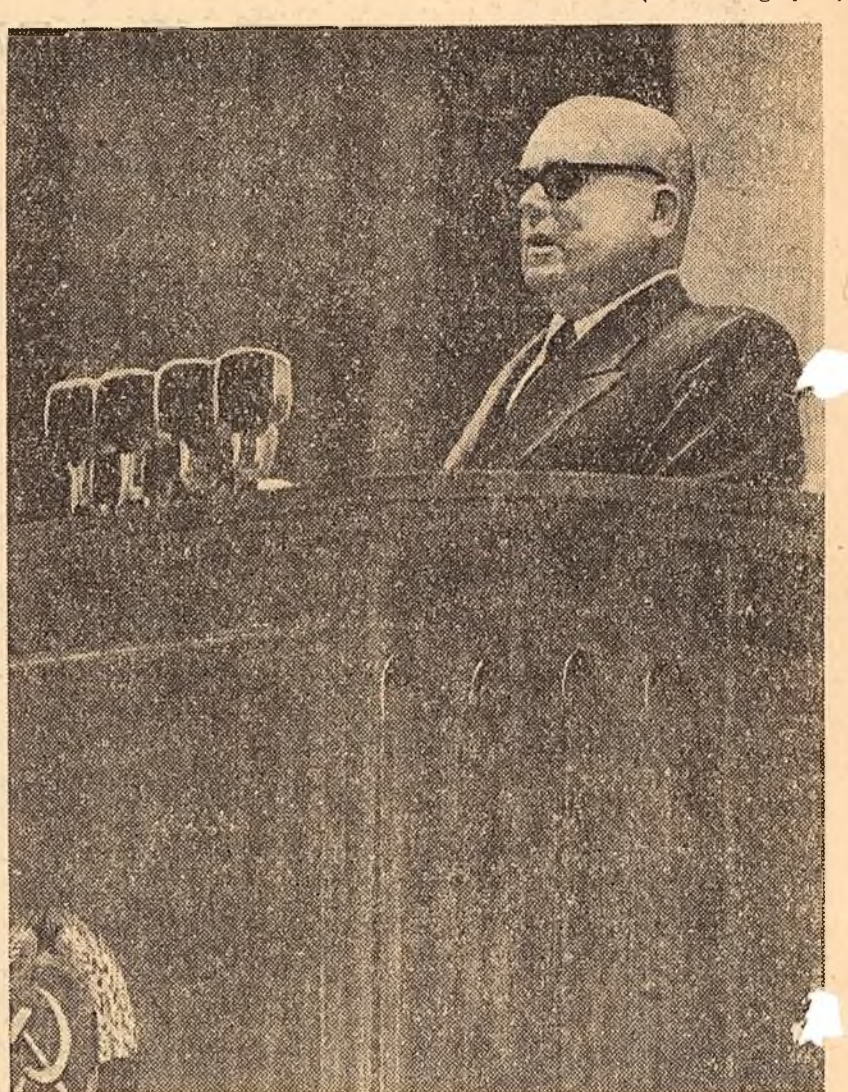
Tovarășul Chivu Stoica, membru al Biroului Politic al C.C. al P.M.R., președintele Consiliului de Miniștri al R. P. Romine, roșindu-și cuvîntul la sesiunea jubiliară a Sovietului Suprem al U.R.S.S.