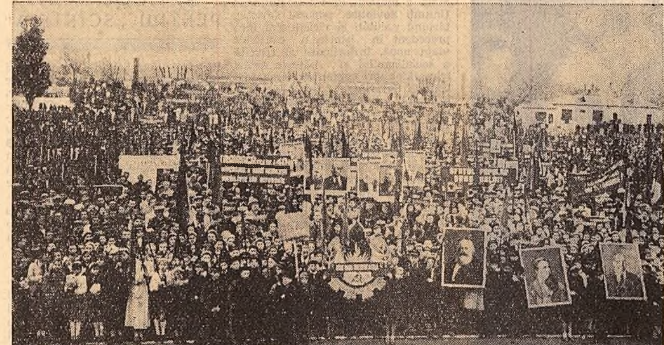
Numeroși oameni ai muncii au participat la mitingul care a avut loc la Galați cu prilejul celei de-a 40-a aniversări a Marii Revoluții Socialiste din Octombrie.