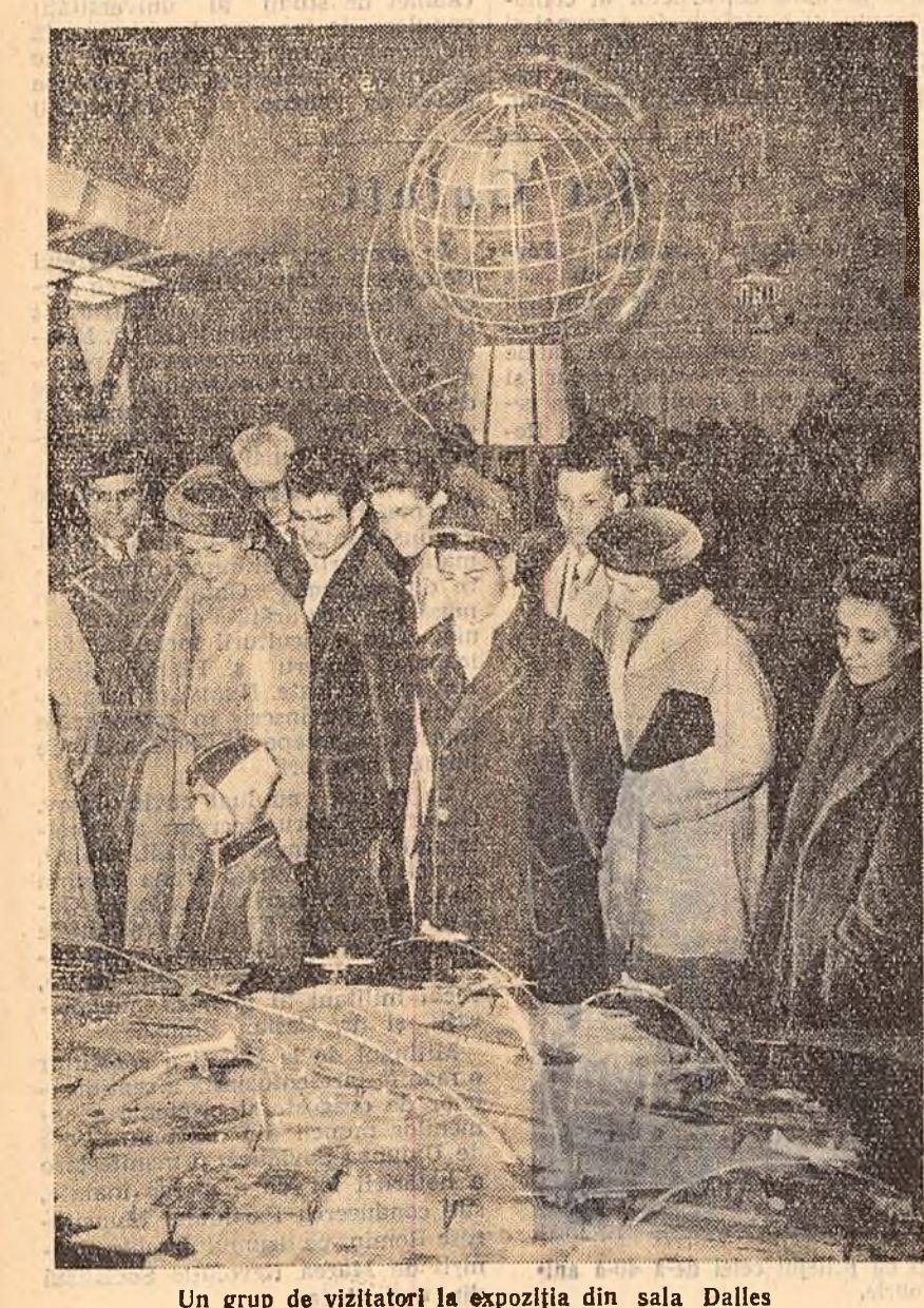
Un grup de vizitatori la expoziția din sala Dalles