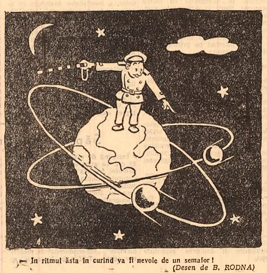
În ritmul ăsta în curînd va fi nevoie de un semafor! (Desen de B. RODNA)

Să fie un meci al prieteniei, în care cei doi nu sînt de câștig. Și să nădăjduim că, azi radio-ul vă va da vești bune. C. MANTU