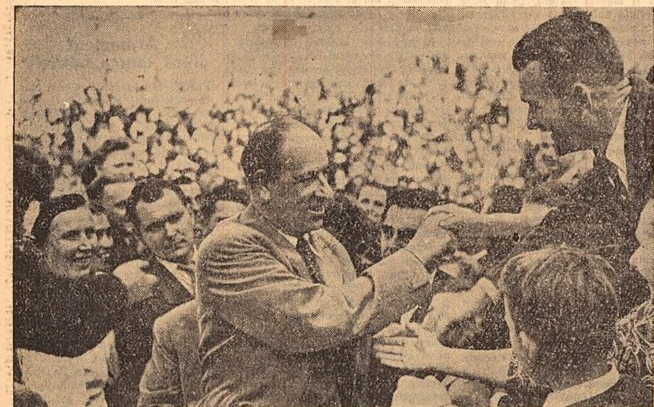
Antonin Zapotocky era apropiat de toți cei ce muncesc, muncitorii, țărani sau intelectuali, bucurându-se de dragostea și adinul respect al oamenilor muncii. În clipa: Antonin Zapotocky înconjurat de mulțimea care-l aclamă și-l felicitează cu prilejul împlinirii a 70 de ani.