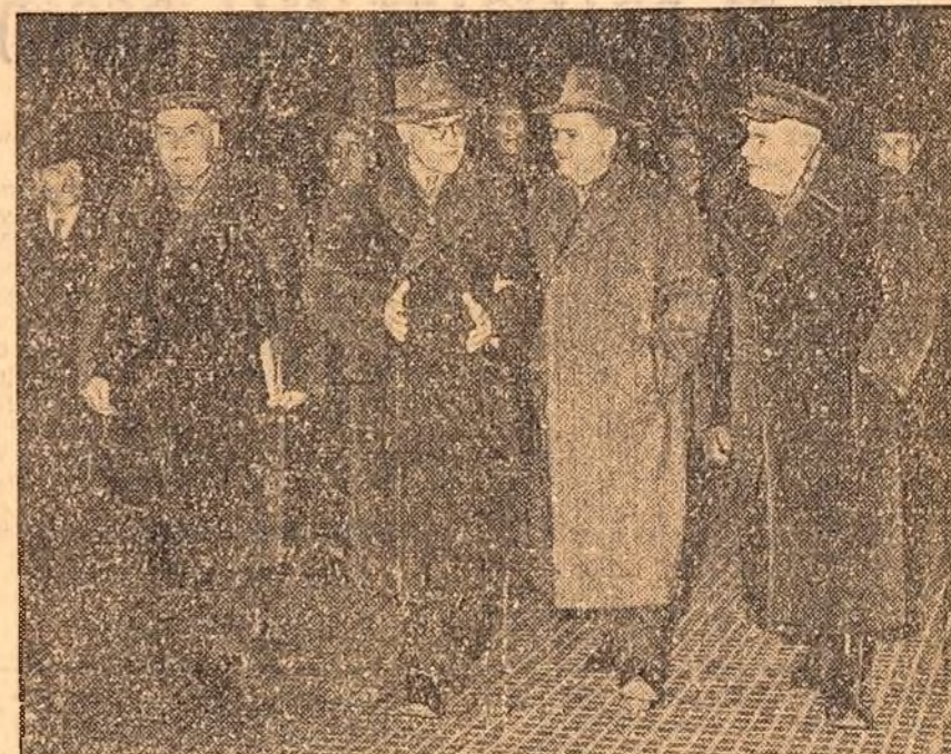
In Gara de Nord, la plecarea oaspeților