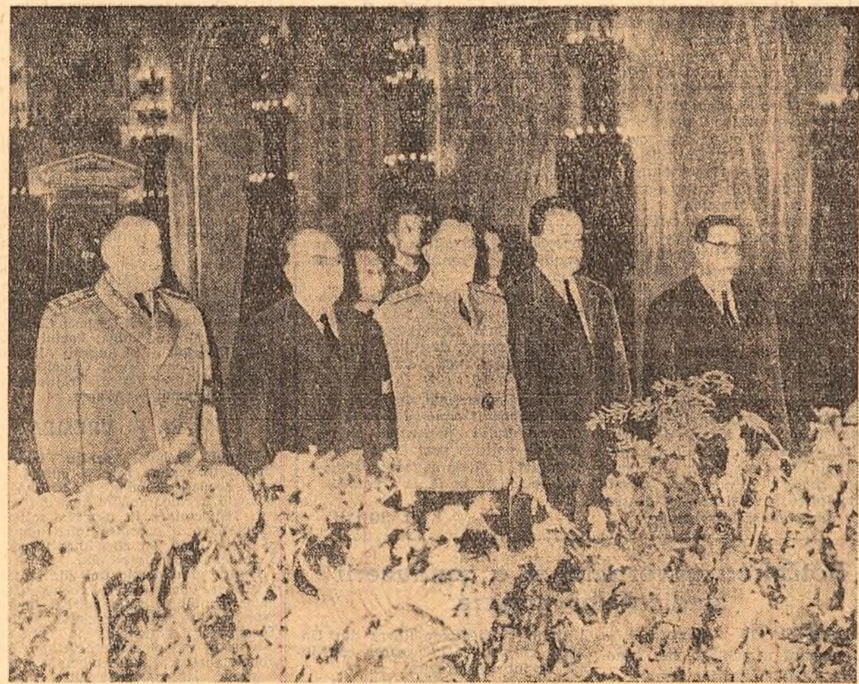
Delegația guvernamentală a R. P. Romine la funeraliile tovarășului Antonin Zapotocky.