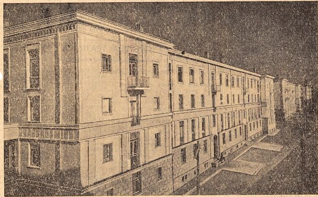
În cartierele orașului Iași, în locul ruinelor lăsate de război, s-au ridicat și se ridică numeroase blocuri muncitorești, case individuale, cămine etc. Numai în blocurile Păcurari sunt în construcție 9 blocuri muncitorești cu câte 40-50 apartamente fiecare. În 4 blocuri s-au și mutat deja noii locatari. În ciljeu: un aspect al blocurilor noi construite în cartierul Păcurari.