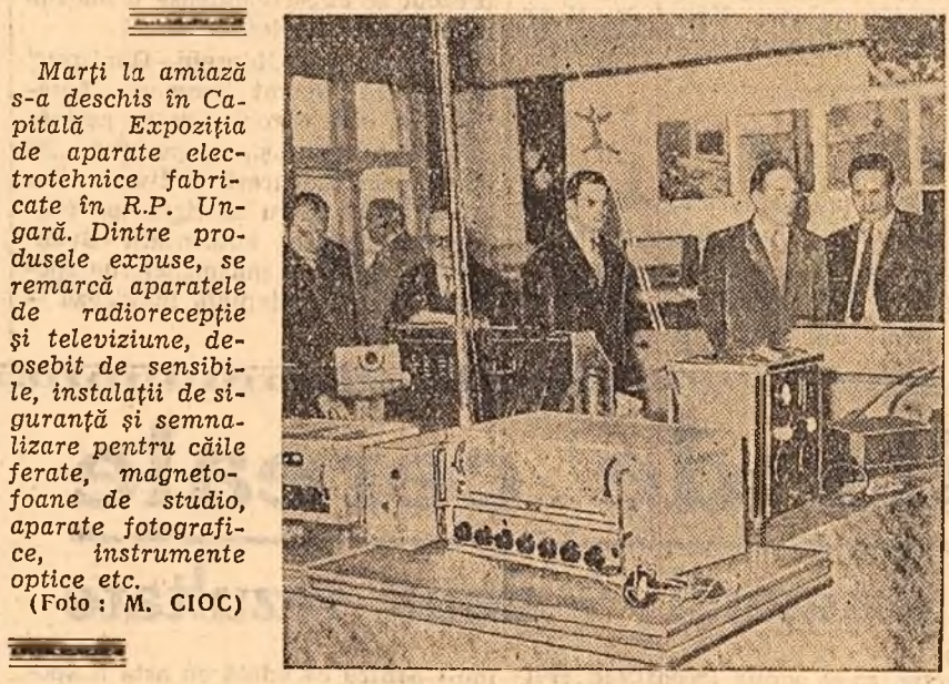
Marți la amiază s-a deschis în Capitală Expoziția de aparate electrotehnice fabricate în R.P. Ungaria. Dintre produsele expuse, se remarcă aparatele de radiorecepție și televiziune, deosebit de sensibile, instalațiile de sigurare pentru căile ferate, magnetofone de studio, aparate fotografice, instrumente optice etc.