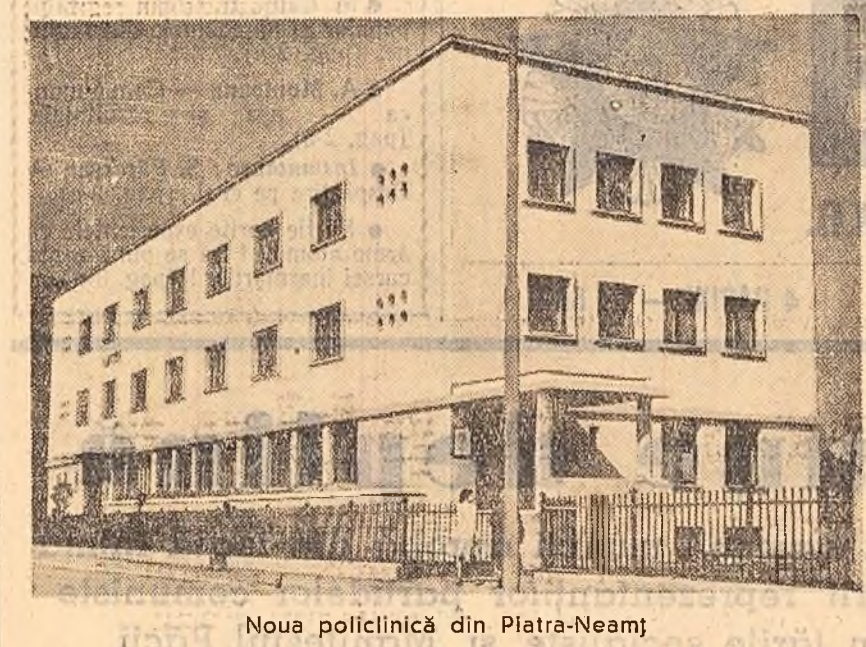
Noua policlinică din Piatra-Neamț